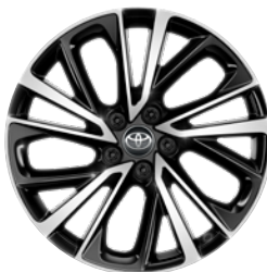
19" felgi aluminiowe z oponami 225/50 R19 Standard w wersji Executive