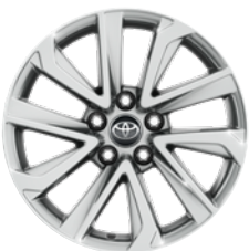
17" felgi aluminiowe z oponami 215/60 R17 Standard w wersji Comfort