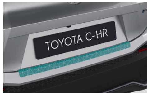
– Folia ochronna na tylny zderzak