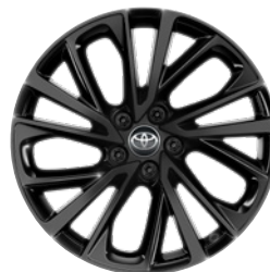
19" felgi aluminiowe GR SPORT z oponami 225/50 R19 Standard w wersji GR SPORT

Kolor nadwozia może być zależny od wersji wyposażenia.