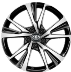
18" felgi aluminiowe z oponami 225/55 R18 Standard w wersjach Business i Style