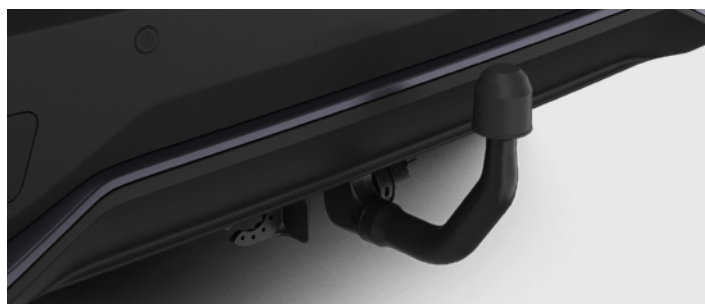
– Hak holowniczy wypinany pionowo + wiązka elektryczna 13 PIN