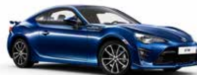
K3X Racing Blue*