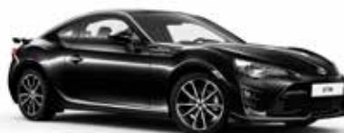
D4S Crystal Black metalik