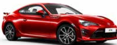
M7Y Monaco Red