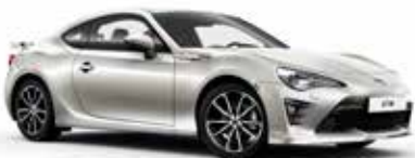
K1X Crystal White*