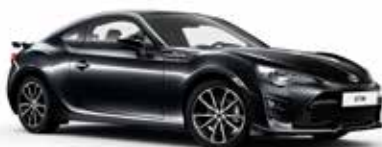
61K Dark Grey metalik