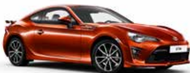
H8R Fusion Orange metalik