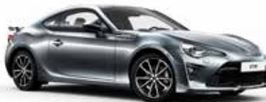
G1U Ice Silver metalik