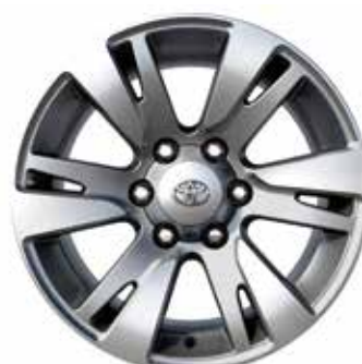
18" FELGI ALUMINIOWE