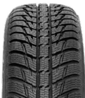
OPONY NOKIAN WR SUV3

KOŁA SĄ WYPOSAŻONE W FABRYCZNY SYSTEM MONITOROWANIA CIŚNIENIA.