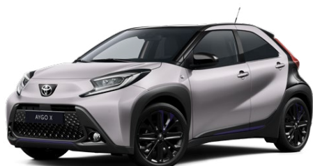
M14 Jasmine Silver/Eclipse Black lakier metalizowany bez dopłaty – JBL