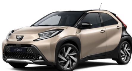
2VJ Ginger Beige/Eclipse Black lakier metalizowany bez dopłaty – Style, Executive