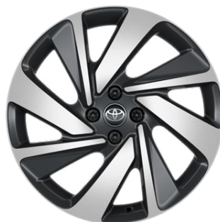
18" felgi aluminiowe z oponami 175/60 R18 Standard w wersji Executive