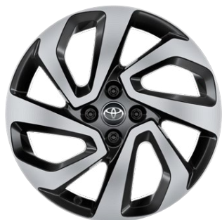
17" felgi aluminiowe z oponami 175/65 R17 Standard w wersji Style