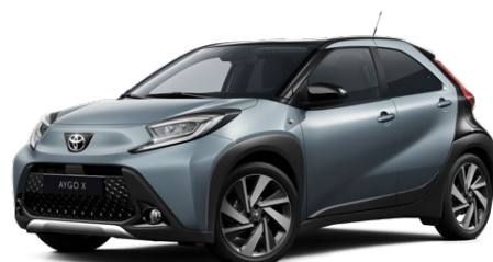
2UP Celestial Grey/Eclipse Black lakier metalizowany bez dopłaty – Style, Executive