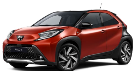
2VH Chili Red/Eclipse Black lakier metalizowany bez dopłaty – Style, Executive