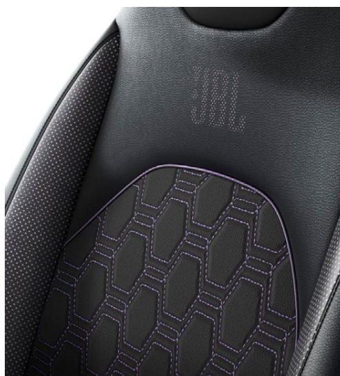
Tapicerka materiałowa z elementami skóry ekologicznej z logo JBL Standard w wersji JBL