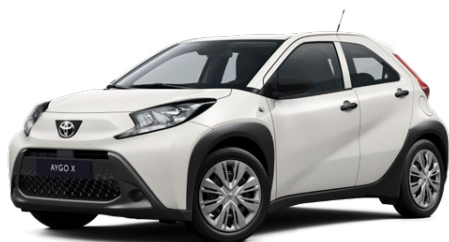
040 Pure White lakier podstawowy bez dopłaty – Comfort