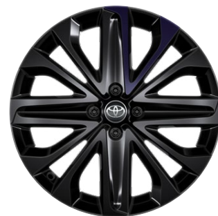
18" felgi aluminiowe czarne z detalami w kolorze Dark Jasmine i oponami 175/60 R18 Standard w wersji JBL