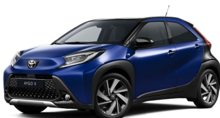
2VL Juniper Blue/Eclipse Black lakier metalizowany bez dopłaty – Style, Executive