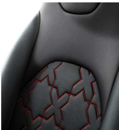
Tapicerka materiałowa z elementami skóry ekologicznej ze wzorami ozdobnymi w kolorze nadwozia Standard w wersji Executive