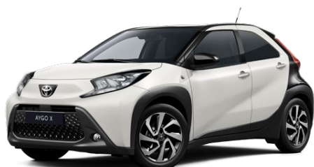
2NR Pure White/Eclipse Black lakier podstawowy bez dopłaty – Style