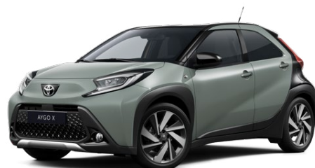
2VN Urban Khaki/Eclipse Black lakier metalizowany bez dopłaty – Style, Executive