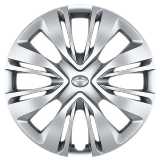
17" felgi stalowe z kołpakami i oponami 175/65 R17 Standard w wersji Comfort