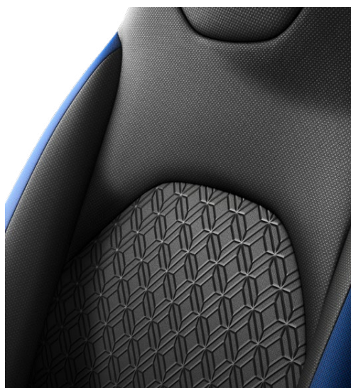
Tapicerka materiałowa ze wzorami ozdobnymi w kolorze nadwozia Standard w wersji Style