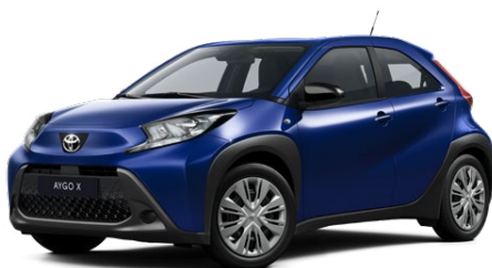
8Y8 Juniper Blue lakier metalizowany 2 000 PLN – Comfort