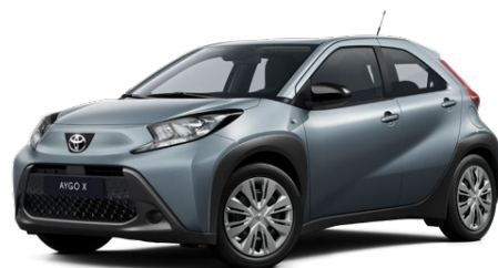
1K3 Celestial Grey lakier metalizowany 2 000 PLN – Comfort