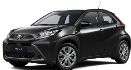
209 Eclipse Black lakier metalizowany 2 000 PLN – Comfort