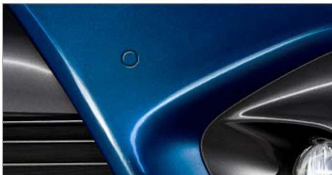
Pakiet Park jest dostępny dla wersji Active, Premium, Selection i Prestige.