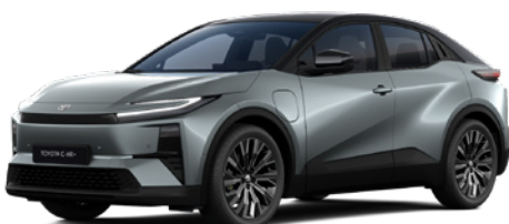
M66 Mineral Mist/Attitude Black lakier metalizowany bez dopłaty – Executive