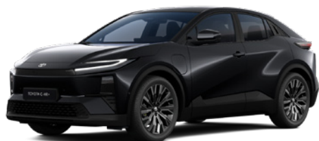
218 Attitude Black lakier metalizowany bez dopłaty – Style