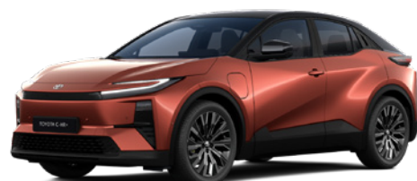
M67 Volcano Orange/Attitude Black lakier specjalny bez dopłaty – Executive