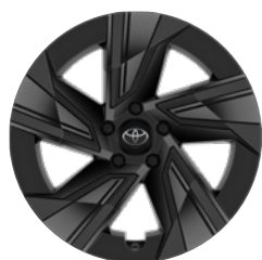
18" felgi aluminiowe z oponami 235/60 R18 (z kołpakami aerodynamicznymi) Standard w wersji Style