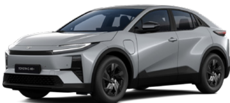
1H5 Manhattan Grey lakier metalizowany 2 500 PLN – Style