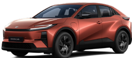
4Z3 Volcano Orange lakier specjalny 3 500 PLN – Style