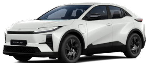
089 Platinum White Pearl lakier perłowy 3 500 PLN – Style