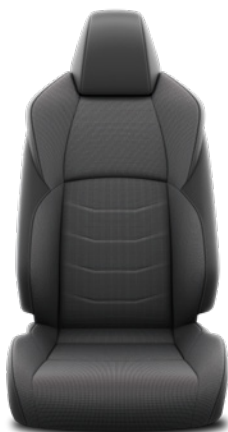
Tapicerka materiałowo-skórzana w kolorze czarnym (skóra syntetyczna) Standard w wersji Style