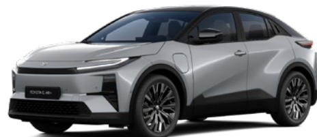
2YY Manhattan Grey/Attitude Black lakier metalizowany bez dopłaty – Executive