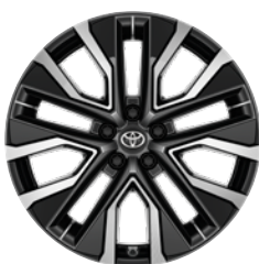
20" felgi aluminiowe z oponami 235/50 R20 (z kołpakami aerodynamicznymi) Standard w wersji Style z Pakietem Dynamic