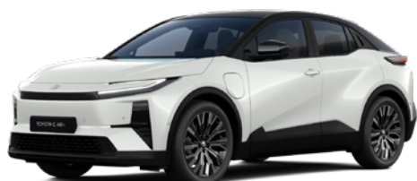
2PS Platinum White Pearl/Attitude Black lakier perłowy bez dopłaty – Executive