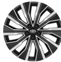
20" felgi aluminiowe z oponami 235/50 R20 Standard w wersji Executive