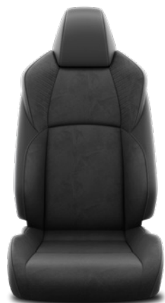
Tapicerka zamshowo-skórzana w kolorze czarnym (materiały syntetyczne) Standard w wersji Executive