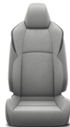
Tapicerka zamshowo-skórzana w kolorze jasnoszarym (materiały syntetyczne) Standard w wersji Executive