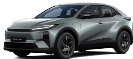
6Y1 Mineral Mist lakier metalizowany 2 500 PLN – Style