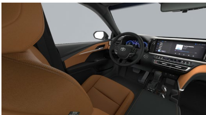
Tapicerka skórzana (skóra naturalna i syntetyczna) w kolorze brązowym Standard w wersjach Prestige i Executive