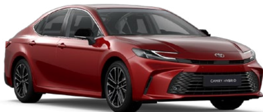
3U9 Royal Red lakier specjalny 4 400 PLN

Kolor nadwozia może być zależny od wersji wyposażenia.