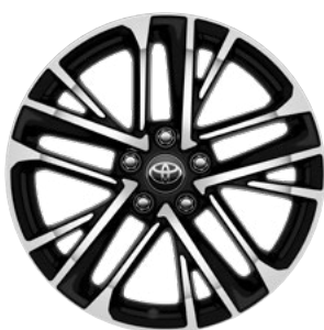
18" felgi aluminiowe z oponami 235/45 R18 Standard w wersjach Prestige i Executive