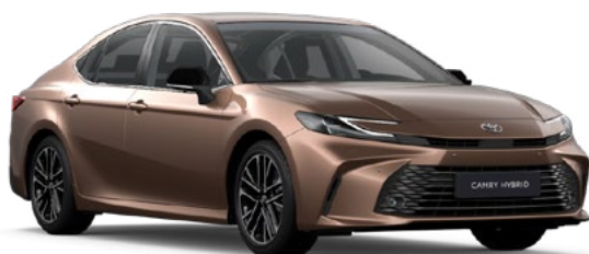
4Y6 Precious Bronze lakier specjalny 4 400 PLN