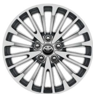
17" felgi aluminiowe z oponami 215/55 R17 Standard w wersji Comfort