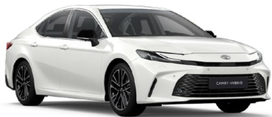
040 Pure White lakier podstawowy bez dopłaty