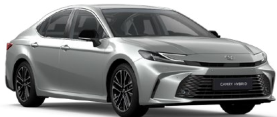
1F7 Silver Diamond lakier metalizowany 2 900 PLN