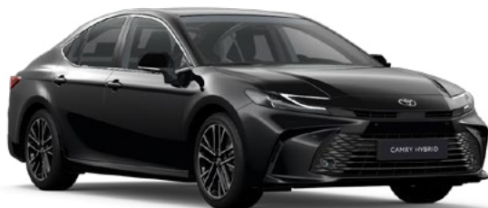
218 Attitude Black lakier metalizowany 2 900 PLN