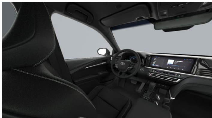
Tapicerka skórzana (skóra syntetyczna) w kolorze czarnym Standard w wersji Comfort z Pakietem Business