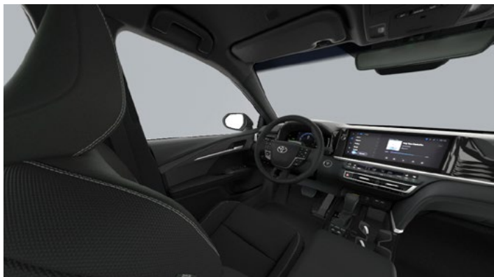
Tapicerka materiałowa w kolorze czarnym Standard w wersji Comfort