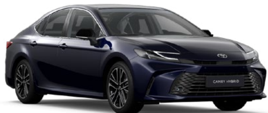
8X8 Elite Blue lakier metalizowany 2 900 PLN