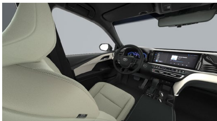
Tapicerka skórzana (skóra naturalna i syntetyczna) w kolorze beżowym Standard w wersjach Prestige i Executive