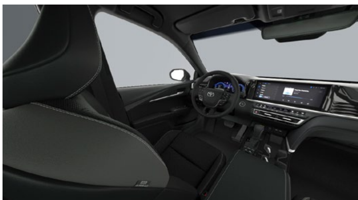
Tapicerka skórzana (skóra naturalna i syntetyczna) w kolorze czarnym Standard w wersjach Prestige i Executive