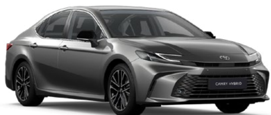
1L5 Precious Metal lakier metalizowany 2 900 PLN