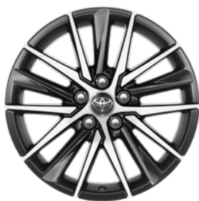
18" felgi aluminiowe z oponami 235/45 R18 Standard w wersjach Prestige i Executive