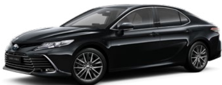
218 Attitude Black lakier metalizowany 2 900 PLN