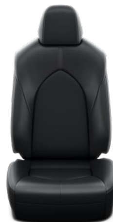
Tapicerka skórzana w kolorze czarnym (skóra naturalna i syntetyczna) Standard w wersjach Executive i Comfort z Pakietem Business