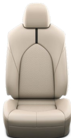
Tapicerka skórzana w kolorze beżowym (skóra naturalna i syntetyczna) Standard w wersjach Executive i Comfort z Pakietem Business