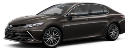
4X7 Graphite Bronze lakier metalizowany 2 900 PLN