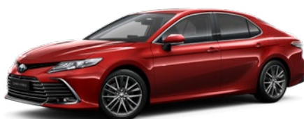
3U9 Royal Red lakier specjalny 4 400 PLN

Kolor nadwozia może być zależny od wersji wyposażenia.