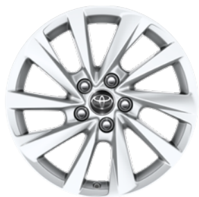
17" felgi aluminiowe z oponami 215/55 R17 Standard w wersji Comfort