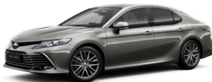
1L5 Precious Metal lakier metalizowany 4 400 PLN