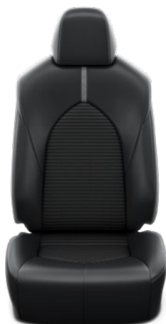
Tapicerka skórzana (skóra syntetyczna) z elementami materiału Standard w wersji Prestige