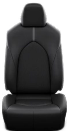
Tapicerka materiałowa Standard w wersji Comfort