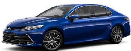
8W7 Dark Blue lakier metalizowany 2 900 PLN