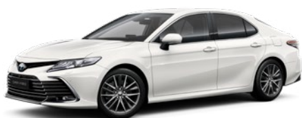
040 Pure White lakier podstawowy bez dopłaty