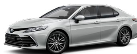
1F7 Silver Diamond lakier metalizowany 2 900 PLN