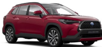
3T3 Tokyo Red lakier specjalny 3 500 PLN