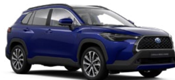
8W7 Dark Blue lakier metalizowany 2 500 PLN