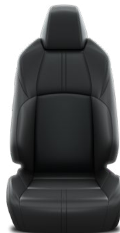
Tapicerka skórzana (skóra naturalna i syntetyczna) Standard w wersji Executive