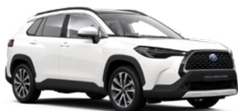
040 Pure White lakier podstawowy bez dopłaty