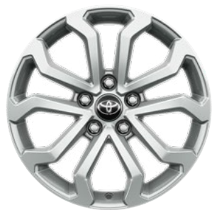
17" felgi aluminiowe z oponami 215/60 R17 Standard w wersji Comfort