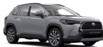
1H5 Manhattan Grey lakier metalizowany 2 500 PLN