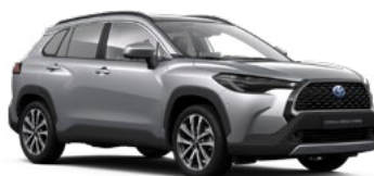
1L0 Shimmering Silver lakier metalizowany 2 500 PLN