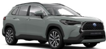
6X3 Urban Khaki lakier podstawowy 2 500 PLN