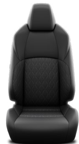
Tapicerka materiałowa w kolorze czarnym Standard w wersjach Comfort i Style