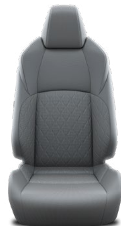
Tapicerka materiałowa w kolorze szarym Standard w wersjach Comfort i Style