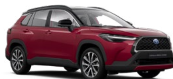
2YD Tokyo Red/ Attitude Black lakier specjalny bez dopłaty – Executive*

Poglądowe kolory nadwozia, mogą się różnić od rzeczywistych.