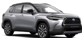
M12 Shimmering Silver/ Attitude Black lakier metalizowany bez dopłaty – Executive*