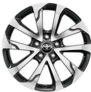
18" felgi aluminiowe z oponami 225/50 R18 Standard w wersjach Style i Executive