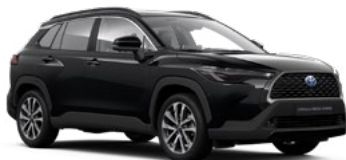
218 Attitude Black lakier metalizowany 2 500 PLN