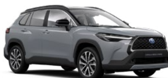
2YY Manhattan Grey/ Attitude Black lakier metalizowany bez dopłaty – Executive*