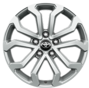
17" felgi aluminiowe z oponami 215/60 R17 Standard w wersji Comfort