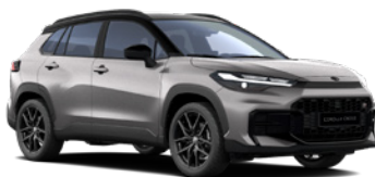
2NK Metal Stream/ Eclipse Black lakier metalizowany bez dopłaty – GR SPORT