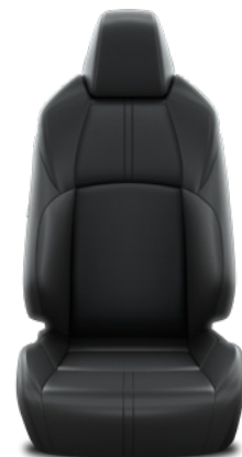
Tapicerka skórzana (skóra naturalna i syntetyczna) Standard w wersji Executive