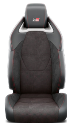
Tapicerka z ekologicznego zamszu Ultrasuede™ ze skórzanymi boczkami (skóra syntetyczna) Standard w wersji GR SPORT