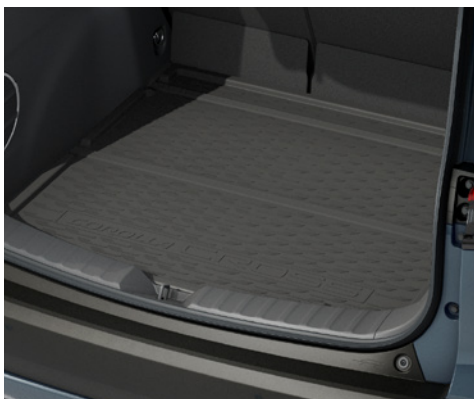
– Wykładzina bagażnika