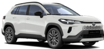
040 Pure White lakier podstawowy bez dopłaty – Comfort, Style