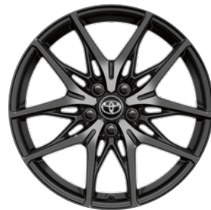
19" felgi aluminiowe GR SPORT z oponami 225/45 R19 Standard w wersji GR SPORT