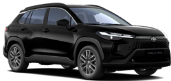
209 Eclipse Black lakier metalizowany 2 500 PLN – Comfort, Style; bez dopłaty – Executive