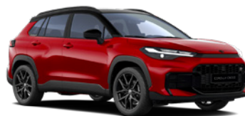
2TB Imperial Red/ Eclipse Black lakier specjalny bez dopłaty – GR SPORT