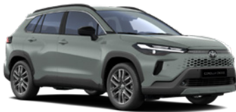
6X3 Urban Khaki lakier podstawowy 2 500 PLN – Comfort, Style, Executive