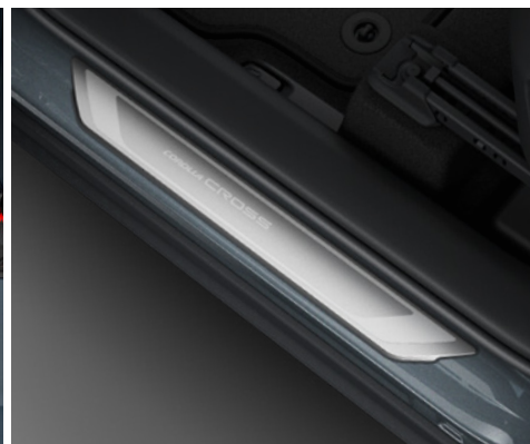
– Nakładki progowe