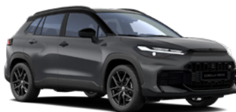
M29 Storm Grey/ Eclipse Black lakier metalizowany bez dopłaty – GR SPORT