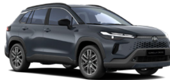
1L6 Massive Grey lakier metalizowany 2 500 PLN – Comfort, Style, Executive