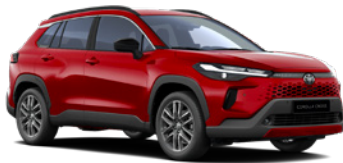
3U5 Imperial Red lakier specjalny 3 500 PLN – Style, Executive