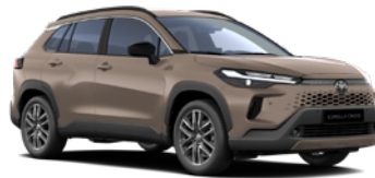
4Z2 Mud Bath lakier metalizowany 2 500 PLN – Comfort, Style, Executive