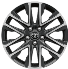
18" felgi aluminiowe z oponami 225/50 R18 Standard w wersjach Style i Executive