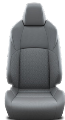
Tapicerka materiałowa w kolorze szarym Standard w wersjach Comfort i Style