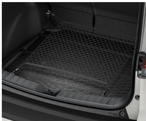
– Siatka bagażnika

Najniższa cena z ostatnich 30 dni – 1 000 PLN (wersja Comfort) 0 PLN (pozostałe wersje) dostępny dla wszystkich wersji