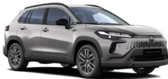
1K0 Metal Stream lakier metalizowany 2 500 PLN – Comfort, Style, Executive