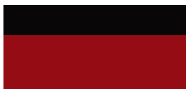
2SZ Imperial Red/ Eclipse Black lakier specjalny bez dopłaty – GR SPORT