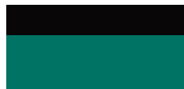
M28 Super Green/ Eclipse Black lakier specjalny bez dopłaty – GR SPORT

Przedstawione kolory nadwozia są poglądowe i mogą różnić się od rzeczywistych. Dostępność kolorów może się różnić w zależności od wersji wyposażenia.