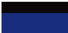
2VL Juniper Blue/ Eclipse Black lakier metalizowany bez dopłaty – GR SPORT