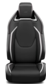
Tapicerka materiałowa z elementami skóry syntetycznej GR SPORT Standard w wersji GR SPORT