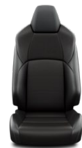
Tapicerka materiałowa z elementami skóry syntetycznej Standard w wersji Style