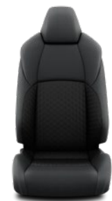
Tapicerka materiałowa Standard w wersji Comfort