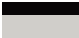
2RD Precious Silver/ Eclipse Black lakier specjalny bez dopłaty – GR SPORT