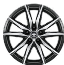
18" felgi aluminiowe GR SPORT z oponami 225/40 R18 Standard w wersji GR SPORT z Pakietem Dynamic