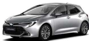
1L0 Shimmering Silver lakier metalizowany 2 500 PLN