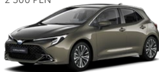
6X1 Oxide Bronze lakier metalizowany 2 500 PLN