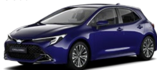
8Y8 Juniper Blue lakier metalizowany 2 500 PLN