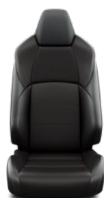
Tapicerka materiałowa z elementami skóry syntetycznej Standard w wersji Style