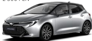
2TX Shimmering Silver/ Eclipse Black lakier metalizowany bez dopłaty – GR SPORT