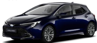
8X8 Elite Blue lakier metalizowany 2 500 PLN