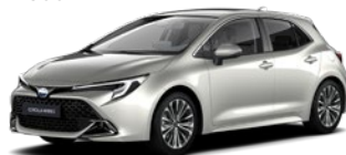
1J6 Precious Silver lakier specjalny 3 500 PLN