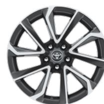
18" felgi aluminiowe z oponami 225/40 R18 Standard w wersji Executive