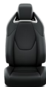
Tapicerka skórzana (skóra naturalna i syntetyczna) w kolorze ciemnym Standard w wersji Executive