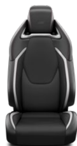
Tapicerka materiałowa z elementami skóry syntetycznej GR SPORT Standard w wersji GR SPORT