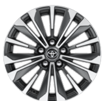
17" felgi aluminiowe z oponami 225/45 R17 Standard w wersji Style