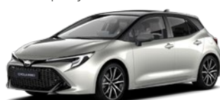
2RD Precious Silver/ Eclipse Black lakier specjalny bez dopłaty – GR SPORT