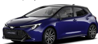
2VL Juniper Blue/ Eclipse Black lakier metalizowany bez dopłaty – GR SPORT