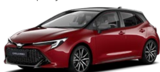
2SZ Imperial Red/ Eclipse Black lakier specjalny bez dopłaty – GR SPORT