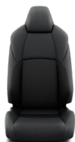
Tapicerka materiałowa Standard w wersji Comfort