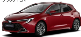
3U5 Imperial Red lakier specjalny 3 500 PLN