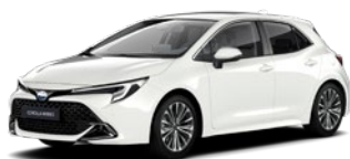
040 Pure White lakier podstawowy bez dopłaty