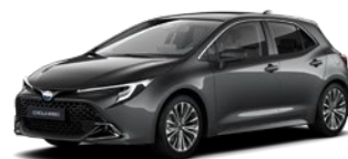
1G3 Royal Grey lakier metalizowany 2 500 PLN