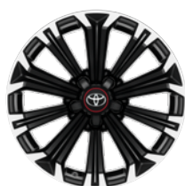
17" felgi aluminiowe GR SPORT z oponami 225/45 R17 Standard w wersji GR SPORT