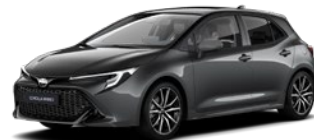
2MB Royal Grey/ Eclipse Black lakier metalizowany bez dopłaty – GR SPORT