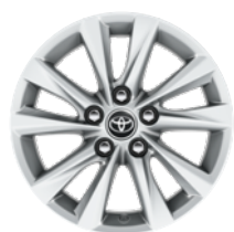
16" felgi aluminiowe z oponami 205/55 R16 Standard w wersji Comfort