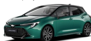
M28 Super Green/ Eclipse Black lakier specjalny bez dopłaty – GR SPORT

Przedstawione kolory nadwozia są poglądowe i mogą różnić się od rzeczywistych. Dostępność kolorów może się różnić w zależności od wersji wyposażenia.