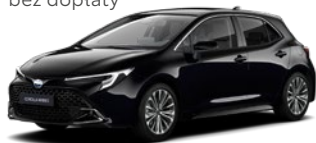
209 Eclipse Black lakier metalizowany 2 500 PLN