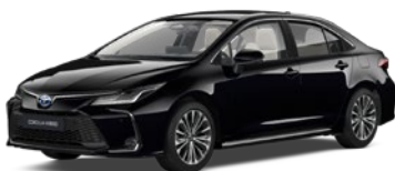
209 Eclipse Black lakier metalizowany 2 500 PLN