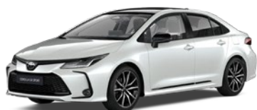
2VP Platinum White Pearl/Eclipse Black lakier perłowy bez dopłaty – GR SPORT