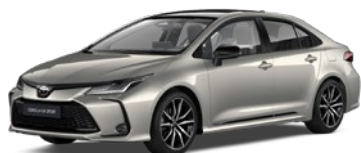
2MR Precious Silver/Eclipse Black lakier specjalny bez dopłaty – GR SPORT

Kolor nadwozia może być zależny od wersji wyposażenia. * Kolor poglądowy, może się różnić od rzeczywistego.