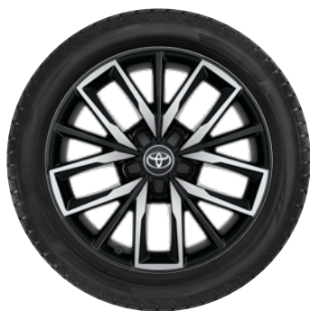
17" felgi aluminiowe, opony Nokian Snowproof CENA BRUTTO