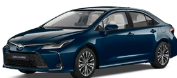
785 Dark Teal* lakier metalizowany 2 500 PLN