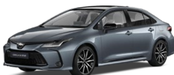
2TH Celestial Grey/Eclipse Black lakier metalizowany bez dopłaty – GR SPORT