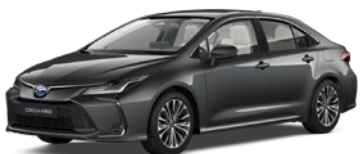
1G3 Royal Grey lakier metalizowany 2 500 PLN