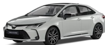
2VF Dynamic Grey/Eclipse Black lakier metalizowany bez dopłaty – GR SPORT