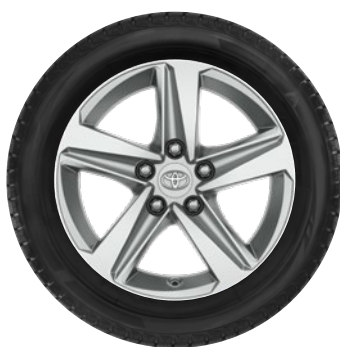
16" felgi aluminiowe, opony Nokian WR D4 CENA BRUTTO