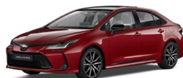
2TB Imperial Red/Eclipse Black lakier metalizowany bez dopłaty – GR SPORT