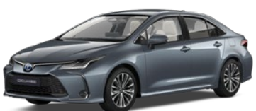
1K3 Celestial Grey lakier metalizowany 2 500 PLN