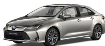
1J6 Precious Silver lakier specjalny 3 500 PLN