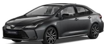
2NB Royal Grey/Eclipse Black lakier metalizowany bez dopłaty – GR SPORT