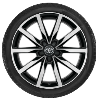
18" felgi aluminiowe, opony Nokian Snowproof CENA BRUTTO