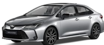
2VU Shimmering Silver/Eclipse Black lakier metalizowany bez dopłaty – GR SPORT