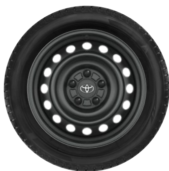
16" felgi stalowe, opony Dunlop Winter Sport 5 CENA BRUTTO