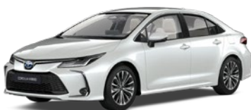
089 Platinum White Pearl lakier perłowy 3 500 PLN