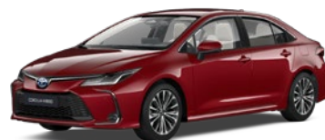
3U5 Imperial Red lakier specjalny 3 500 PLN