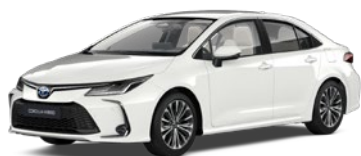
040 Pure White lakier podstawowy bez dopłaty