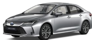
1L0 Shimmering Silver lakier metalizowany 2 500 PLN