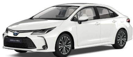
040 Pure White lakier podstawowy bez dopłaty