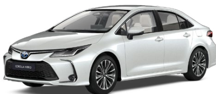
089 Platinum White Pearl lakier perłowy 3 500 PLN