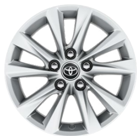
16" felgi aluminiowe z oponami 205/55 R16 Standard w wersji Comfort