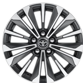
17" felgi aluminiowe z oponami 225/45 R17 Standard w wersji Style