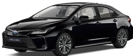
209 Eclipse Black lakier metalizowany 2 500 PLN