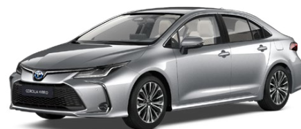
1L0 Shimmering Silver lakier metalizowany 2 500 PLN