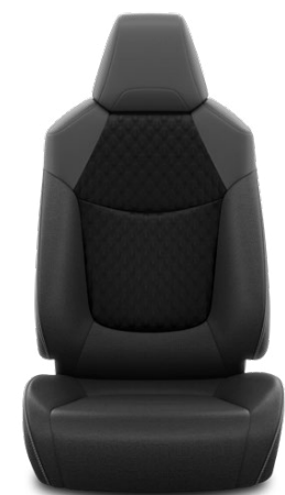
Tapicerka materiałowa w kolorze ciemnym Standard w wersjach Comfort i Style