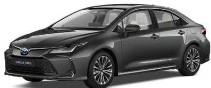
1G3 Royal Grey lakier metalizowany 2 500 PLN