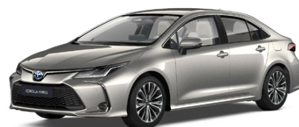
1J6 Precious Silver lakier specjalny 3 500 PLN

Kolor nadwozia może być zależny od wersji wyposażenia. * Kolor poglądowy, może się różnić od rzeczywistego.