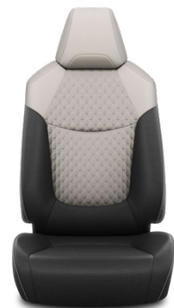
Tapicerka materiałowa w kolorze jasnym Standard w wersjach Comfort i Style