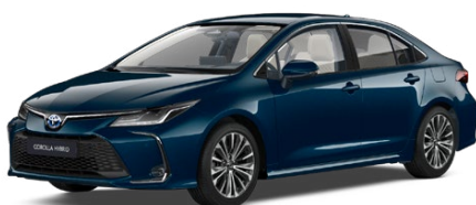
785 Dark Teal* lakier metalizowany 2 500 PLN