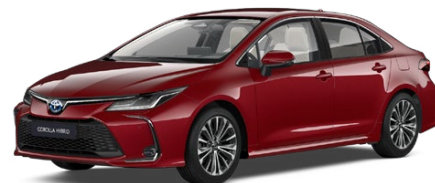
3U5 Imperial Red lakier specjalny 3 500 PLN