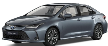
1K3 Celestial Grey lakier metalizowany 2 500 PLN