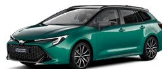
M28 Super Green/ Eclipse Black lakier specjalny bez dopłaty – GR SPORT

Przedstawione kolory nadwozia są poglądowe i mogą różnić się od rzeczywistych. Dostępność kolorów może się różnić w zależności od wersji wyposażenia.