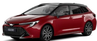
2SZ Imperial Red/ Eclipse Black lakier specjalny bez dopłaty – GR SPORT