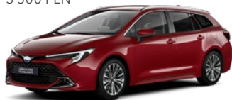
3U5 Imperial Red lakier specjalny 3 500 PLN