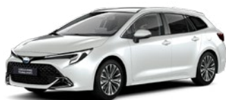
089 Platinum White Pearl lakier perłowy 3 500 PLN