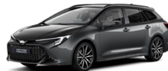
2MB Royal Grey/ Eclipse Black lakier metalizowany bez dopłaty – GR SPORT