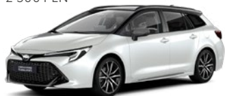
2PU Platinum White Pearl/ Eclipse Black lakier perłowy bez dopłaty – GR SPORT