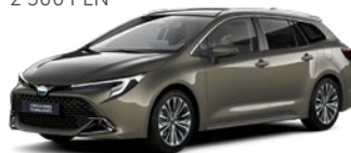
6X1 Oxide Bronze lakier metalizowany 2 500 PLN