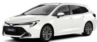
040 Pure White lakier podstawowy bez dopłaty