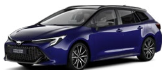
2VL Juniper Blue/ Eclipse Black lakier metalizowany bez dopłaty – GR SPORT