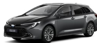
1G3 Royal Grey lakier metalizowany 2 500 PLN