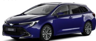
8Y8 Juniper Blue lakier metalizowany 2 500 PLN