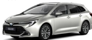
1J6 Precious Silver lakier specjalny 3 500 PLN