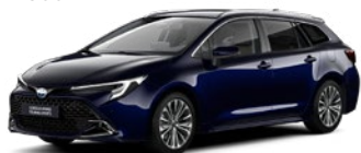
8X8 Elite Blue lakier metalizowany 2 500 PLN