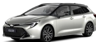
2RD Precious Silver/ Eclipse Black lakier specjalny bez dopłaty – GR SPORT