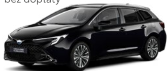
209 Eclipse Black lakier metalizowany 2 500 PLN