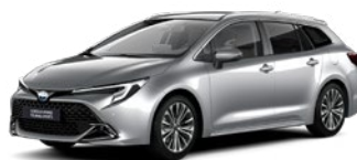
1L0 Shimmering Silver lakier metalizowany 2 500 PLN