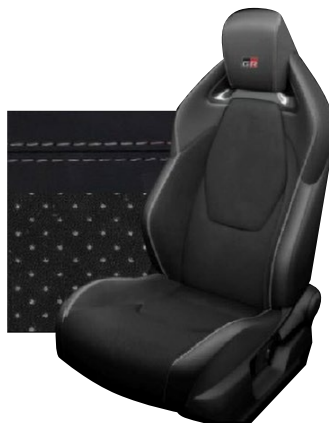
Tapicerka z ekologicznego zamssu w kolorze czarnym ze skózanymi boczkami i wykończeniem w kolorze szarym Standard w wersjach Dynamic i Dynamic z Pakietem VIP