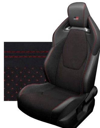
Tapicerka z ekologicznego zamssu w kolorze czarnym ze skózanymi boczkami i wykończeniem w kolorze czerwonym Standard w wersjach Dynamic i Dynamic z Pakietem VIP