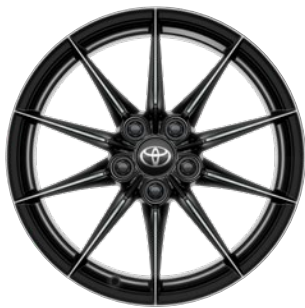
18" kute felgi aluminiowe z oponami 225/40 R18 Standard w wersji Dynamic z Pakietem VIP