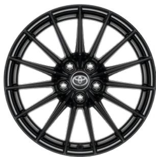
18" felgi aluminiowe z oponami 225/40 R18 Standard w wersji Dynamic