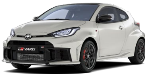
089 Platinum Pearl White lakier perłowy 2 900 PLN