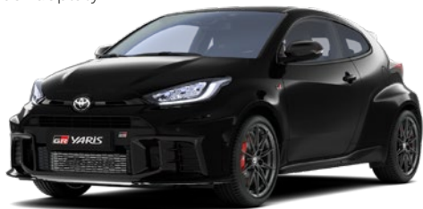
219 Precious Black lakier metalizowany 2 000 PLN