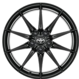
18" kute felgi aluminiowe z oponami 225/40 R18 Standard w wersji Dynamic z Pakietem VIP