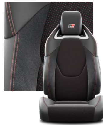
Tapicerka z ekologicznego zamszu w kolorze czarnym ze skórzanymi boczkami i wykończeniem w kolorze czerwonym Standard w wersjach Dynamic i Dynamic z Pakietem VIP