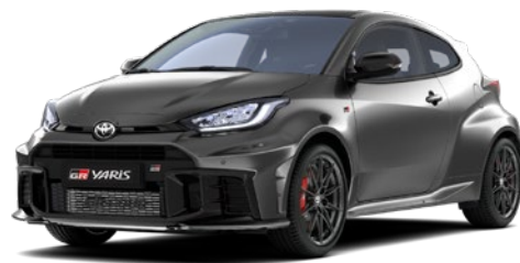
1L5 Precious Metal lakier metalizowany 2 000 PLN