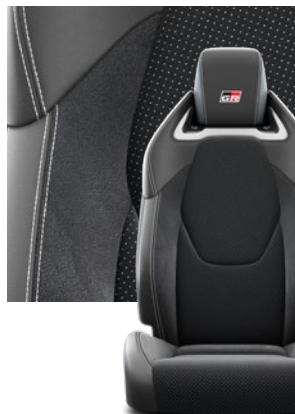
Tapicerka z ekologicznego zamszu w kolorze czarnym ze skórzanymi boczkami i wykończeniem w kolorze szarym Standard w wersjach Dynamic i Dynamic z Pakietem VIP