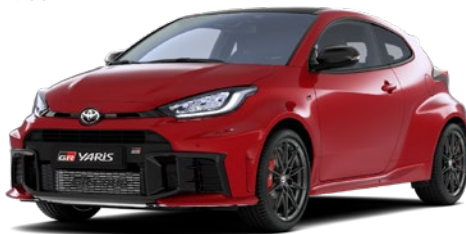
3U5 Imperial Red lakier specjalny 2 900 PLN