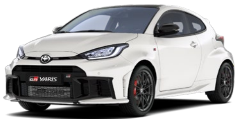
040 Pure White lakier podstawowy bez dopłaty