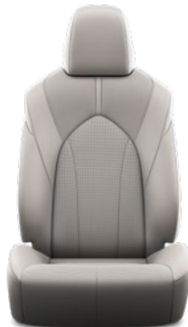
Tapicerka skórzana z perforacją (skóra naturalna i syntetyczna) w kolorze szarym Standard w wersji Prestige