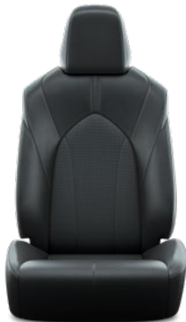
Tapicerka skórzana z perforacją (skóra naturalna i syntetyczna) w kolorze czarnym Standard w wersji Prestige