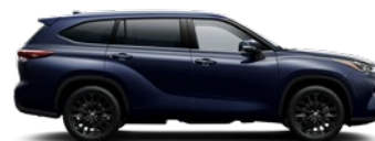
8X8 Elite Blue lakier metalizowany bez dopłaty – Comfort, Prestige, Executive