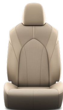
Tapicerka skórzana z perforacją (skóra naturalna i syntetyczna) w kolorze beżowym Standard w wersji Prestige