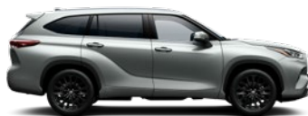
1J9 Silver Metallic lakier metalizowany bez dopłaty – Comfort, Prestige, Executive