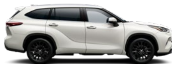
089 Platinum White Pearl lakier perłowy 1 500 PLN – Prestige, Executive