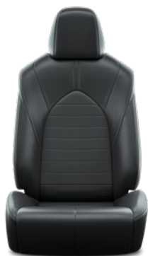
Tapicerka skórzana (skóra syntetyczna) w kolorze czarnym Standard w wersji Comfort