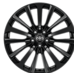
20" felgi aluminiowe w kolorze czarnym z oponami 235/55 R20 Standard w wersji Executive