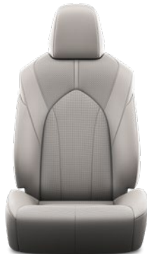
Tapicerka skórzana z perforacją (skóra naturalna i syntetyczna) w kolorze szarym Standard w wersji Prestige