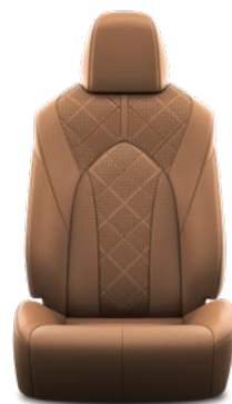
Tapicerka skórzana z perforacją (skóra naturalna i syntetyczna) w kolorze karmelowym Standard w wersji Executive