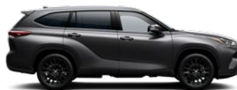
1G3 Royal Grey lakier metalizowany bez dopłaty – Comfort, Prestige, Executive