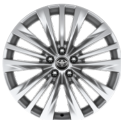
20" felgi aluminiowe z oponami 235/55 R20 Standard w wersji Prestige