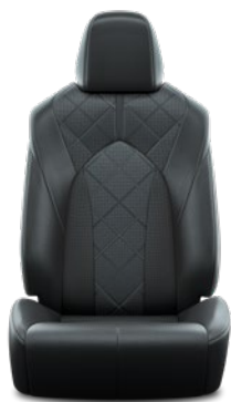
Tapicerka skórzana z perforacją (skóra naturalna i syntetyczna) w kolorze czarnym Standard w wersji Executive