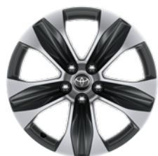
18" felgi aluminiowe z oponami 235/65 R18 Standard w wersji Comfort