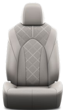
Tapicerka skórzana z perforacją (skóra naturalna i syntetyczna) w kolorze szarym Standard w wersji Executive