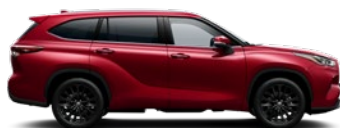
3T3 Tokyo Red lakier specjalny 1 500 PLN – Prestige, Executive