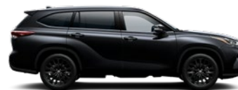
218 Attitude Black lakier metalizowany bez dopłaty – Comfort, Prestige, Executive