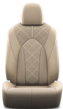
Tapicerka skórzana z perforacją (skóra naturalna i syntetyczna) w kolorze beżowym Standard w wersji Executive