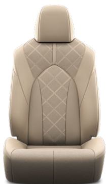
Tapicerka skórzana z perforacją (skóra naturalna i syntetyczna) w kolorze beżowym Standard w wersji Executive