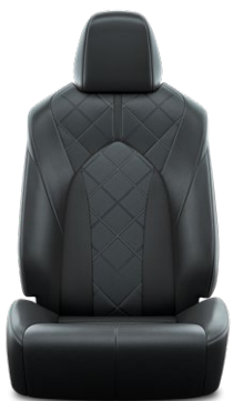
Tapicerka skórzana z perforacją (skóra naturalna i syntetyczna) w kolorze czarnym Standard w wersji Executive