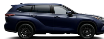
8X8 Elite Blue lakier metalizowany bez dopłaty – Prestige, Executive