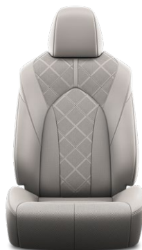
Tapicerka skórzana z perforacją (skóra naturalna i syntetyczna) w kolorze szarym Standard w wersji Executive