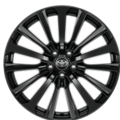
20" felgi aluminiowe w kolorze czarnym z oponami 235/55 R20 Standard w wersji Executive