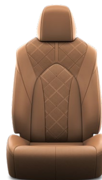
Tapicerka skórzana z perforacją (skóra naturalna i syntetyczna) w kolorze karmelowym Standard w wersji Executive