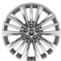
20" felgi aluminiowe z oponami 235/55 R20 Standard w wersji Prestige