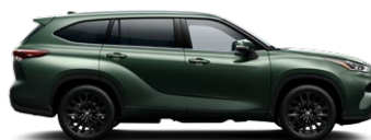
6X5 Cypress Green lakier metalizowany bez dopłaty – Prestige, Executive