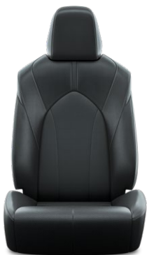
Tapicerka skórzana z perforacją (skóra naturalna i syntetyczna) w kolorze czarnym Standard w wersji Prestige