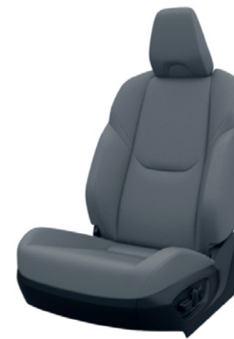
Tapicerka skórzana z perforacją w kolorze szarym (skóra naturalna i syntetyczna) Standard w wersji INVINCIBLE