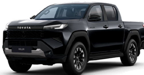
218 Attitude Black lakier metalizowany 3 200 PLN