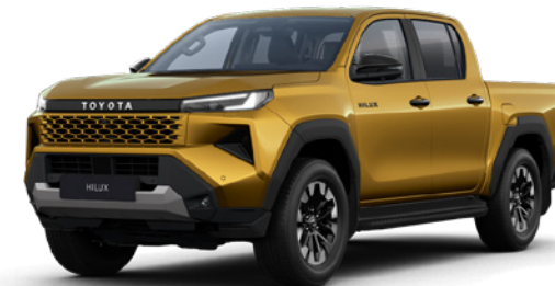
5C7 Sulphur lakier metalizowany 3 200 PLN