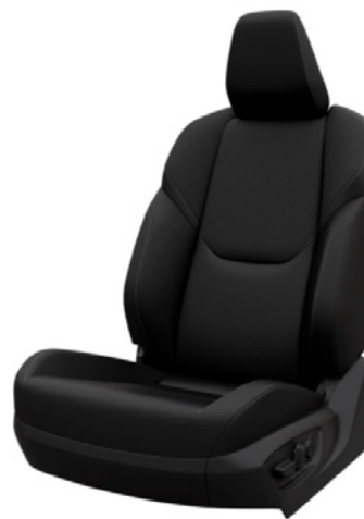
Tapicerka skórzana z perforacją w kolorze czarnym (skóra naturalna i syntetyczna) Standard w wersjach Executive i INVINCIBLE