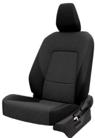
Tapicerka materiałowa w kolorze czarnym Standard w wersji Live