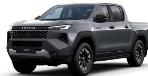
1M2 Storm Grey lakier metalizowany 3 200 PLN