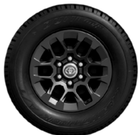
17" felgi aluminiowe w kolorze czarnym z oponami 265/65 R17 Standard w wersji Active