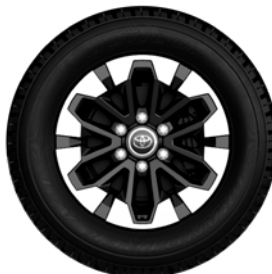
18" felgi aluminiowe licowane z oponami 265/60 R18 Standard w wersji Executive