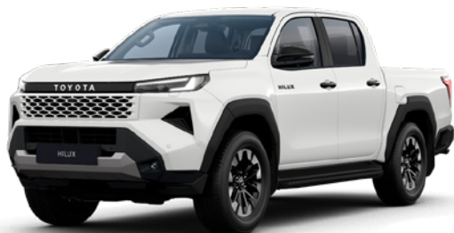
040 Pure White lakier podstawowy bez dopłaty