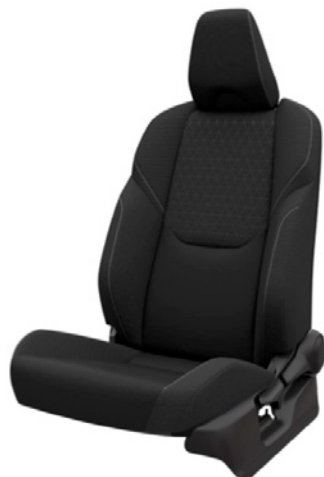
Tapicerka materiałowa w kolorze czarnym Standard w wersji Active