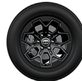
18" felgi aluminiowe w kolorze czarnym z oponami 265/60 R18 Standard w wersji INVINCIBLE