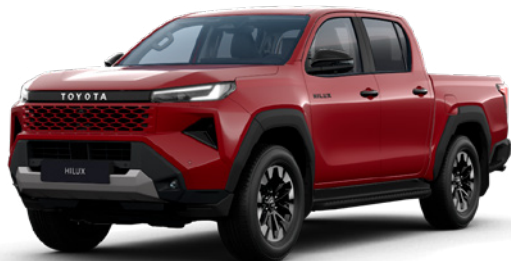
3T6 Crimson Spark Red lakier metalizowany 3 200 PLN