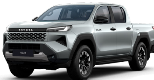
1D6 Misty Silver lakier metalizowany 3 200 PLN