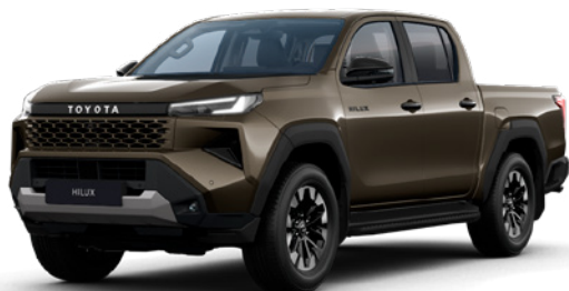
6X1 Oxide Bronze lakier metalizowany 3 200 PLN