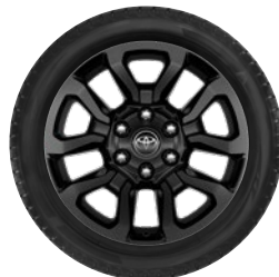
18" felgi aluminiowe w kolorze czarnym z oponami 265/60 R18 Standard w wersji INVINCIBLE