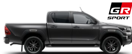
1G3 Royal Grey lakier metalizowany 3 200 PLN