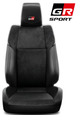
Tapicerka skórzana z perforacją, srebrnymi przeszyciami i emblematem GR Standard w wersji GR SPORT II