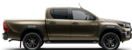
6X1 Oxide Bronze lakier metalizowany 3 200 PLN