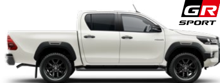
089 Platinum Pearl White lakier perłowy 3 700 PLN

Kolor nadwozia może być zależny od wersji wyposażenia. Nakładki na błotniki są standardowym elementem wyposażenia tylko w wersji INVINCIBLE i GR SPORT.