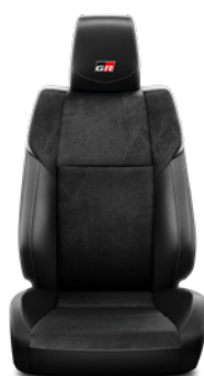
Tapicerka skórzana z perforacją, srebrnymi przeszyciami i emblematem GR Standard w wersji GR SPORT II