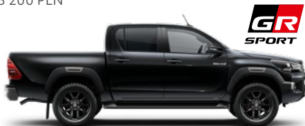
218 Attitude Black lakier metalizowany 3 200 PLN