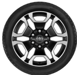
18" felgi aluminiowe z oponami 265/60 R18 Standard w wersji Executive