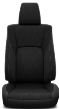
Tapicerka materiałowa w kolorze czarnym Standard w wersji Live w nadwoziu z podwójną kabiną oraz w wersjach Active i Executive