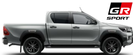
1D6 Misty Silver lakier metalizowany 3 200 PLN