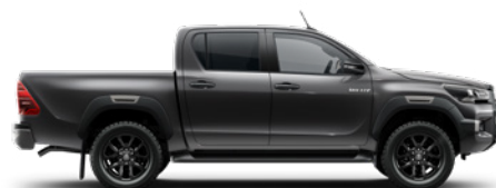
1G3 Royal Grey lakier metalizowany 3 200 PLN