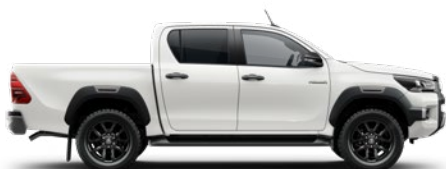
040 Pure White lakier podstawowy bez dopłaty