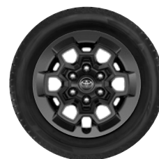
17" felgi aluminiowe GR SPORT w kolorze czarnym w stylizacji DAKAR z oponami 265/65 R17 Standard w wersji GR SPORT II