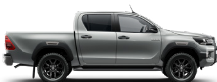
1D6 Misty Silver lakier metalizowany 3 200 PLN