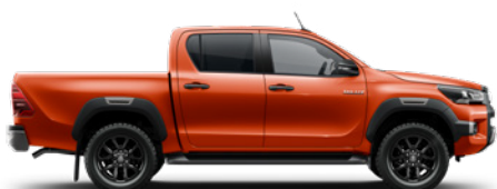
4R8 Hot Orange Lava lakier metalizowany WYPRZEDANE