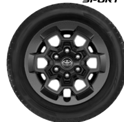
17" felgi aluminiowe GR SPORT w kolorze czarnym w stylizacji DAKAR z oponami 265/65 R17 Standard w wersji GR SPORT II