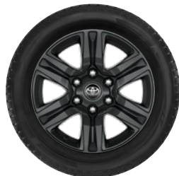
17" felgi aluminiowe z oponami 265/65 R17 Standard w wersji Active