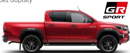
3T6 Crimson Spark Red lakier metalizowany 3 200 PLN