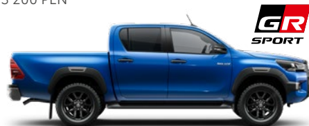
8X2 Nebula Blue lakier metalizowany 3 200 PLN