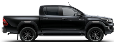
218 Attitude Black lakier metalizowany 3 200 PLN