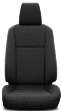
Tapicerka materiałowa w kolorze czarnym Standard w wersji Live w nadwoziu z półtorą kabiną