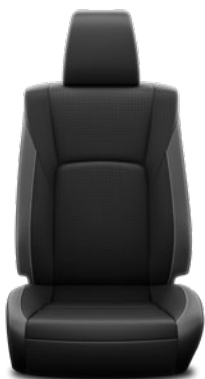
Tapicerka skórzana z perforacją (skóra naturalna i syntetyczna) w kolorze czarnym z szarymi elementami Standard w wersji INVINCIBLE