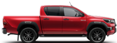
3T6 Crimson Spark Red lakier metalizowany WYPRZEDANE