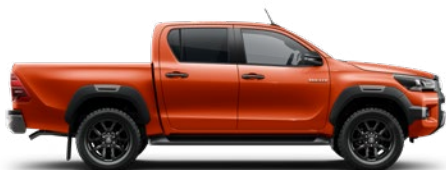
4R8 Hot Orange Lava lakier metalizowany 3 200 PLN