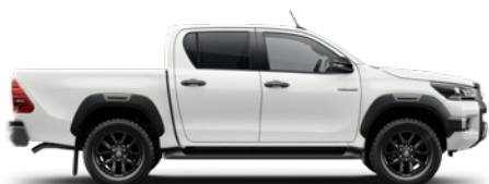
040 Pure White lakier podstawowy WYPRZEDANE