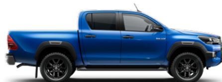
8X2 Nebula Blue lakier metalizowany WYPRZEDANE