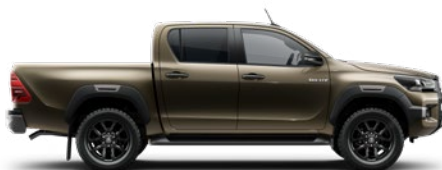
6X1 Oxide Bronze lakier metalizowany 3 200 PLN