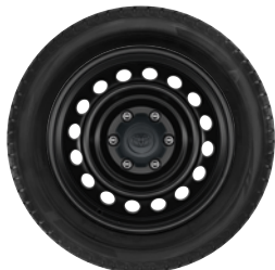
17" felgi stalowe z oponami 265/65 R17 Standard w wersji Live