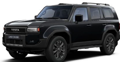
229 Neutral Black lakier metalizowany 4 400 PLN