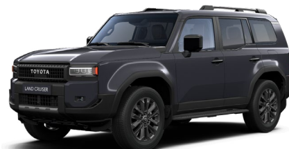
1L7 Dark Grey lakier podstawowy 2 900 PLN