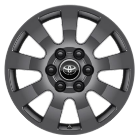
18" felgi aluminiowe z oponami 265/65 R18 Standard w wersji Invincible