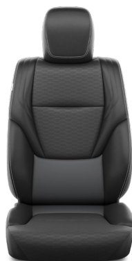
Tapicerka skórzana z perforacją (skóra naturalna i syntetyczna) w kolorze ciemnym Standard w wersji Executive