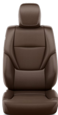
Tapicerka skórzana (skóra syntetyczna) w kolorze brązowym Standard w wersji Invincible