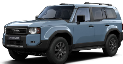
8X0 Smoky Blue lakier podstawowy 2 900 PLN – tylko Invincible