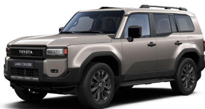
4V8 Avant-garde Bronze lakier metalizowany 4 400 PLN