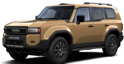
5C8 Sand lakier podstawowy 2 900 PLN