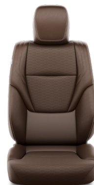
Tapicerka skórzana z perforacją (skóra naturalna i syntetyczna) w kolorze brązowym Standard w wersji Executive