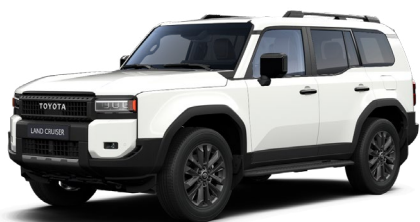
040 Pure White lakier podstawowy bez dopłaty