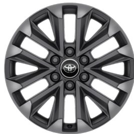
20" felgi aluminiowe z oponami 265/60 R20 Standard w wersji Executive