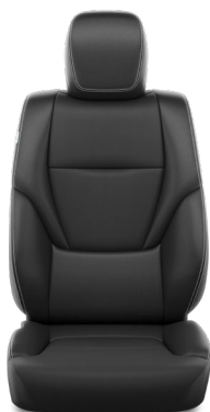
Tapicerka skórzana (skóra syntetyczna) w kolorze ciemnym Standard w wersji Invincible