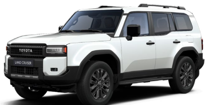
089 Platinum White Pearl lakier perłowy 4 400 PLN