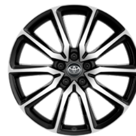
20" felgi aluminiowe GR SPORT z oponami 245/40 R20 Standard w wersji GR SPORT Premiere Edition