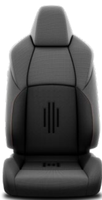
Tapicerka materiałowa w kolorze czarnym Standard w wersjach Comfort Plus i Style