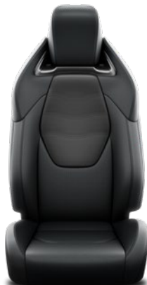
Tapicerka skórzana (skóra naturalna i syntetyczna) Standard w wersji Executive z Pakietem Tech