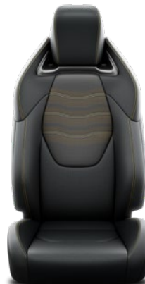
Tapicerka skórzana (skóra naturalna i syntetyczna) z przeszyciami w kolorze Sulphur Standard w wersji Executive Premiere Edition