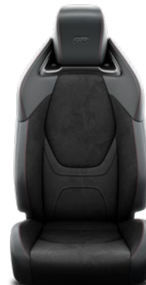
Tapicerka z ekologicznego zamszu Ultrasuede™ Standard w wersjach GR SPORT i GR SPORT Premiere Edition