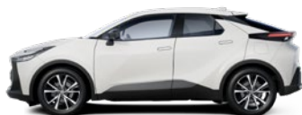
040 Pure White lakier podstawowy bez dopłaty – Comfort Plus, Style