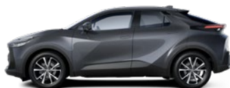
1G3 Royal Grey lakier metalizowany 2 500 PLN – Comfort Plus, Style