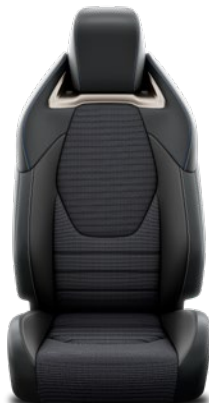
Tapicerka materiałowa z boczками ze skóry syntetycznej oraz elementami syntetycznego zamszu Standard w wersji Executive