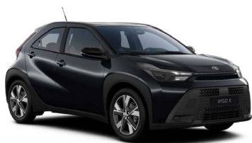
209 Eclipse Black lakier metalizowany 2 000 PLN – Active, Comfort