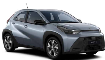
1K3 Celestial Grey lakier metalizowany 2 000 PLN – Active, Comfort