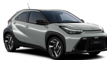
2VN Tarragon/Eclipse Black lakier specjalny bez dopłaty – Style