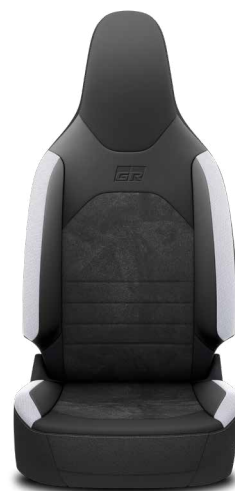
Tapicerka GR SPORT Standard w wersji Style z Pakietem GR SPORT