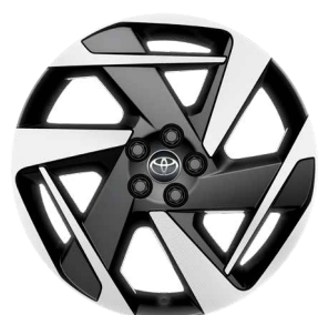
18" felgi aluminiowe czarne z oponami 175/60 R18 (czarne wykończenie) Standard w wersji Style z Pakietem VIP