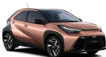
M49 Cinnamon/Eclipse Black lakier metalizowany bez dopłaty – Style