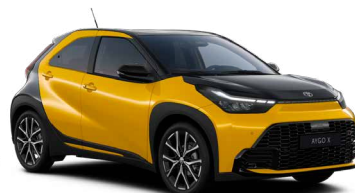
M50 Mustard/Eclipse Black lakier metalizowany bez dopłaty – Style z Pakietem GR SPORT