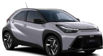
M14 Jasmine Silver/Eclipse Black lakier metalizowany bez dopłaty – Style