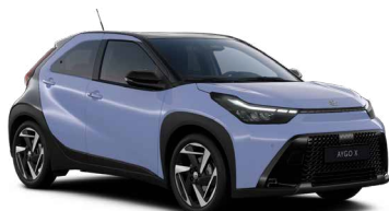
M51 Lavender/Eclipse Black lakier specjalny bez dopłaty – Style