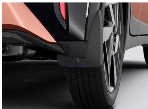
– Osłony przeciwbłotne przednie i tylne