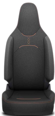
Tapicerka materiałowa z przeszyciami w kolorze nadwozia Standard w wersji Style