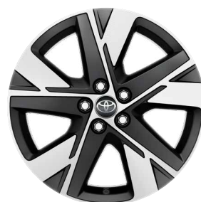
17" felgi aluminiowe czarne z oponami 175/65 R17 (czarne wykończenie) Standard w wersji Style