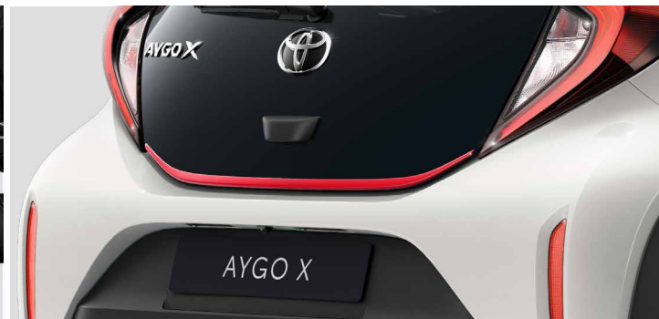
– Listwa pokrywy bagażnika w kolorze czerwonym