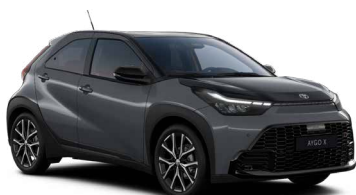
M52 Storm Grey/Eclipse Black lakier metalizowany bez dopłaty – Style z Pakietem GR SPORT