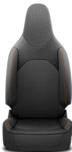
Tapicerka materiałowa z elementami perforowanymi z materiału SakuraTouch Standard w wersji Style z Pakietem VIP