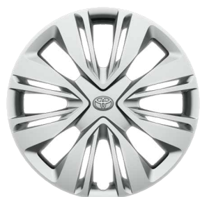
17" felgi stalowe z kołpakami i oponami 175/65 R17 Standard w wersji Active