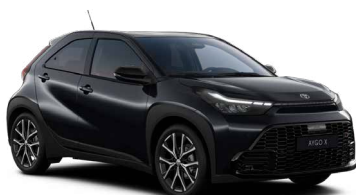
209 Eclipse Black lakier metalizowany bez dopłaty – Style z Pakietem GR SPORT