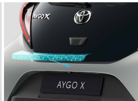
– Folia ochronna tylnego zderzaka