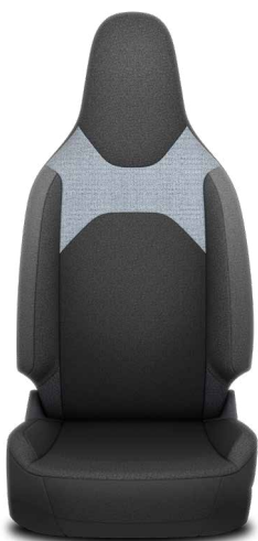
Tapicerka materiałowa Standard w wersjach Active i Comfort