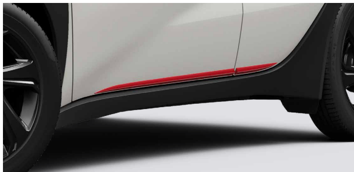
– Ozdobne listwy boczne w kolorze czerwonym