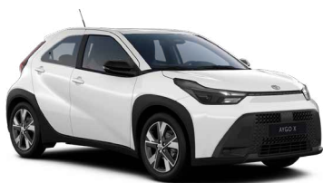
040 Pure White lakier podstawowy bez dopłaty – Active, Comfort