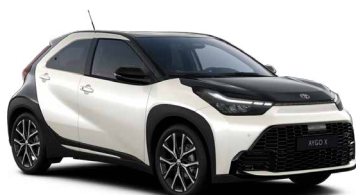
2PU Platinum Pearl White/Eclipse Black lakier perłowy bez dopłaty – Style z Pakietem GR SPORT