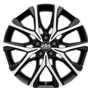
18" felgi aluminiowe GR SPORT z oponami 175/60 R18 Standard w wersji Style z Pakietem GR SPORT