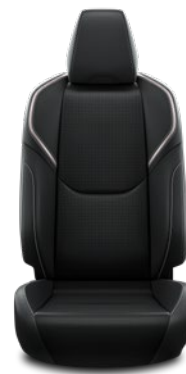
Tapicerka ze skóry wegańskiej w kolorze czarnym Standard w wersji Executive