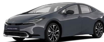
1M2 Storm Grey lakier metalizowany 2 500 PLN