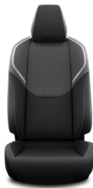
Tapicerka materiałowa w kolorze czarnym Standard w wersjach Comfort i Prestige