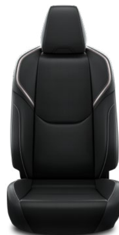
Tapicerka ze skóry wegańskiej w kolorze czarnym Standard w wersji Executive