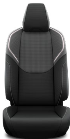
Tapicerka materiałowa w kolorze czarnym Standard w wersjach Comfort i Prestige