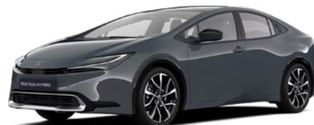
1M2 Storm Grey lakier metalizowany 2 500 PLN