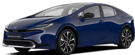
8Q4 Marine Blue lakier podstawowy bez dopłaty