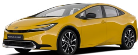
5C5 Mustard lakier metalizowany 2 500 PLN

Kolor nadwozia może być zależny od wersji wyposażenia.