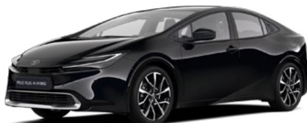
218 Attitude Black lakier metalizowany 2 500 PLN