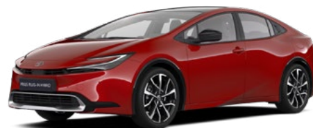
3U5 Imperial Red lakier specjalny 3 500 PLN