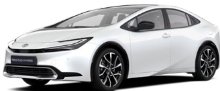
089 Platinum Pearl White lakier perłowy 3 500 PLN