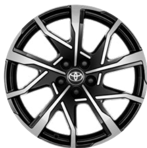
19" felgi aluminiowe z oponami 195/50 R19 Standard w wersjach Prestige i Executive