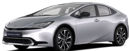
1L0 Shimmering Silver lakier metalizowany 2 500 PLN