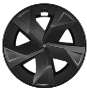
17" felgi aluminiowe z oponami 195/60 R17 (z plastikowymi kołpakami ochronnymi) Standard w wersji Comfort