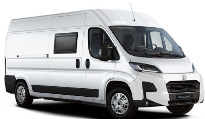
EPR Icy White