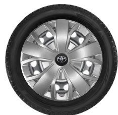
16" felgi stalowe z oponami 215/75 R16C i pełnymi kołpakami