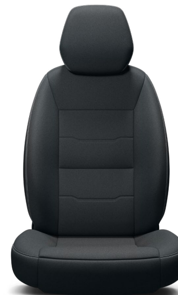
Tapicerka materiałowa z dodatkowymi przetłoczeniami i podwójnymi szarymi przeszciami