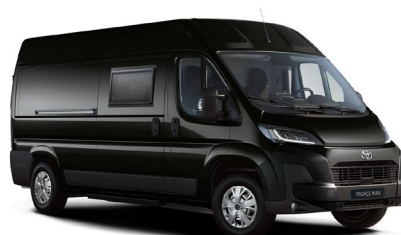
EEA Black Opal