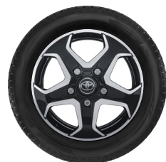
16" felgi aluminiowe z oponami 215/75 R16C