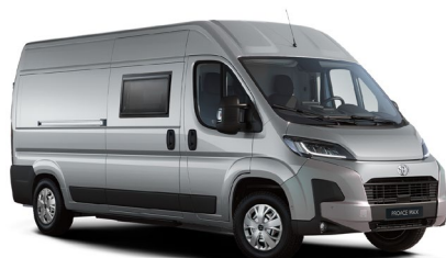
KCA Silver Aluminium