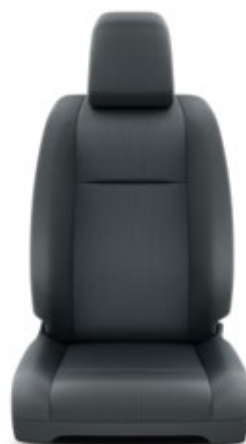
Tapicerka materiałowa w kolorze szarym Standard w wersjach Life