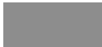
EVL Dark Grey lakier metalizowany 2 200 PLN

Kolor nadwozia może być zależny od wersji wyposażenia.