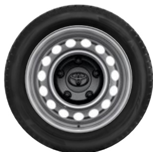
16" felgi stalowe z oponami 215/65 R16C Standard w wersjach Life