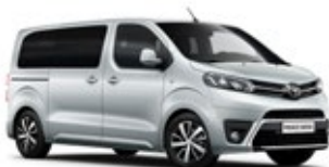
KCA Silver Aluminium lakier metalizowany 2 700 PLN