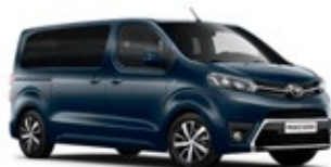
KNP Solid Blue lakier podstawowy bez dopłaty