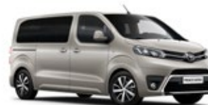
NEU Silver Beige lakier metalizowany 2 700 PLN