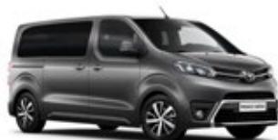
EVL Dark Grey lakier metalizowany 2 700 PLN