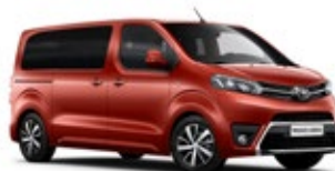
KHK Dark Orange lakier metalizowany 2 700 PLN