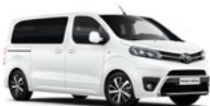
EWP Solid White lakier podstawowy bez dopłaty