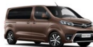
KCM Rich Bronze lakier metalizowany 2 700 PLN

Kolor nadwozia może być zależny od wersji wyposażenia.