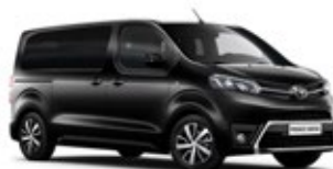
KTV Deep Black lakier metalizowany 2 700 PLN