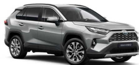
1D6 Misty Silver lakier metalizowany 2 900 PLN