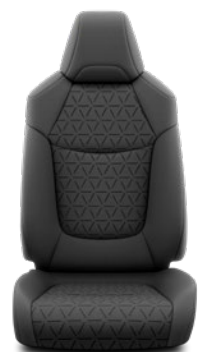
Tapicerka materiałowa w kolorze czarnym Standard w wersji Comfort