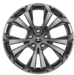
18" felgi aluminiowe z oponami 225/60 R18 Standard w wersji Comfort z Pakietem Style