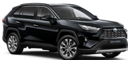
218 Attitude Black lakier metalizowany 2 900 PLN