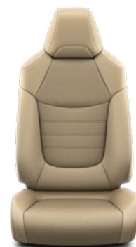
Tapicerka skórzana z perforacją (skóra naturalna i syntetyczna) w kolorze beżowym Standard w wersji Executive