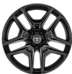
19" felgi aluminiowe GR SPORT z oponami 235/55 R19 Standard w wersji GR SPORT