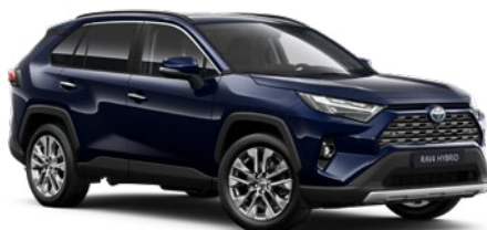
8X8 Elite Blue lakier metalizowany 2 900 PLN