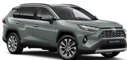
6X3 Urban Khaki lakier podstawowy 2 900 PLN