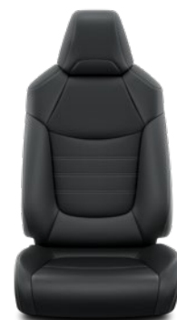
Tapicerka skórzana z perforacją (skóra naturalna i syntetyczna) w kolorze czarnym Standard w wersji Executive