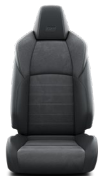
Tapicerka GR SPORT (zamsz syntetyczny i skóra syntetyczna) Standard w wersji GR SPORT