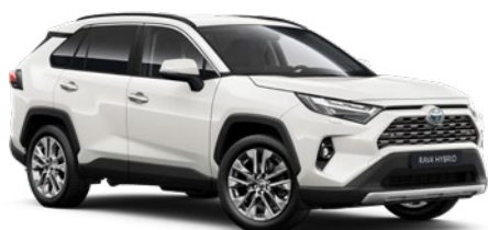
040 Pure White lakier podstawowy bez dopłaty