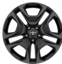
19" felgi aluminiowe w kolorze czarnym matowym z oponami 235/55 R19 Standard w wersji ADVENTURE