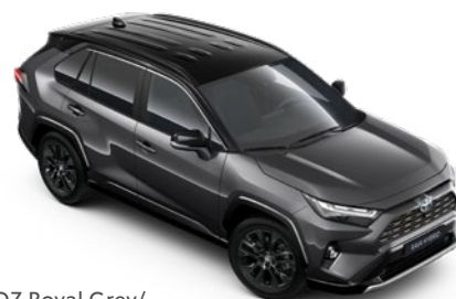
2QZ Royal Grey/ Attitude Black lakier metalizowany bez dopłaty – Selection, GR SPORT