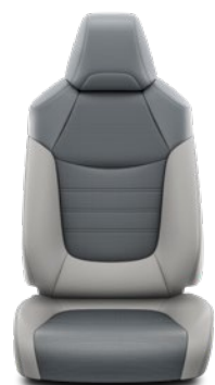
Tapicerka skórzana z perforacją (skóra naturalna i syntetyczna) w kolorze jasnoszarym Standard w wersji Executive