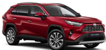
3T3 Tokyo Red lakier specjalny 4 400 PLN