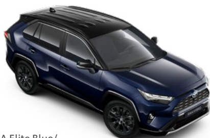
2RA Elite Blue/ Attitude Black lakier metalizowany bez dopłaty – Selection, GR SPORT