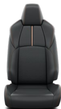
Tapicerka skórzana (skóra syntetyczna) w kolorze czarnym z pomarańczowymi przeszyciami Standard w wersji ADVENTURE