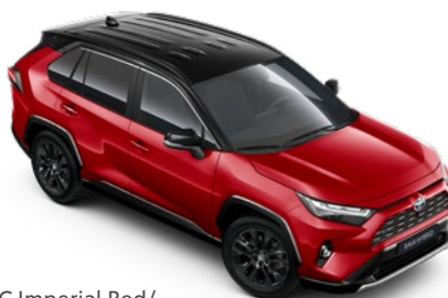
2SC Imperial Red/ Attitude Black lakier metalizowany bez dopłaty – GR SPORT