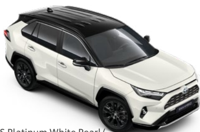
2PS Platinum White Pearl/ Attitude Black lakier perłowy bez dopłaty – Selection, GR SPORT