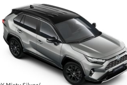
2QY Misty Silver/ Attitude Black lakier metalizowany bez dopłaty – Selection, GR SPORT