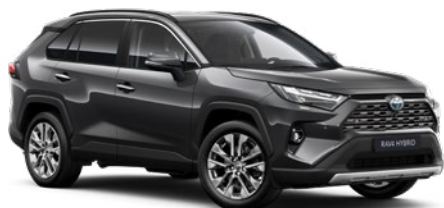
1G3 Royal Grey lakier metalizowany 2 900 PLN