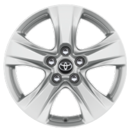
17" felgi aluminiowe z oponami 225/65 R17 Standard w wersji Comfort