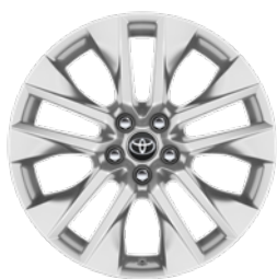
19" felgi aluminiowe z oponami 235/55 R19 Standard w wersji Executive