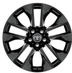
19" felgi aluminiowe w kolorze fortepianowej czerni z oponami 235/55 R19 Standard w wersji Selection