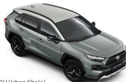
2QU Urban Khaki/ Dynamic Grey lakier podstawowy bez dopłaty – ADVENTURE z Pakietem Bitone

Kolor nadwozia może być zależny od wersji wyposażenia.