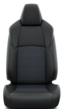
Tapicerka skórzana (skóra syntetyczna) Standard w wersji Selection