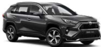
1G3 Royal Grey lakier metalizowany 2 900 PLN