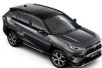
2QZ Royal Grey/Attitude Black lakier metalizowany bez dopłaty – Selection