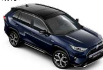
2RA Elite Blue/Attitude Black lakier metalizowany bez dopłaty – Selection