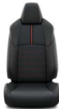
Tapicerka skórzana (skóra naturalna) Opcja w Pakiecie VIP