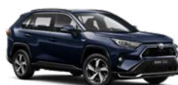
8X8 Elite Blue lakier metalizowany 2 900 PLN