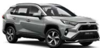
1D6 Misty Silver lakier metalizowany 2 900 PLN