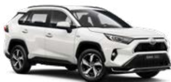
040 Pure White lakier podstawowy bez dopłaty