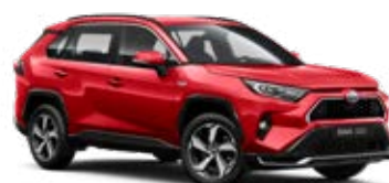
3U5 Imperial Red lakier specjalny 4 400 PLN