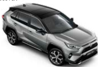
2QY Misty Silver/Attitude Black lakier metalizowany bez dopłaty – Selection