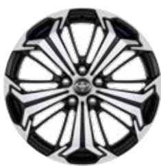
19" felgi aluminiowe z oponami 235/55 R19 Standard w wersji Selection