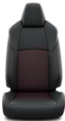
Tapicerka skórzana (skóra syntetyczna) Standard w wersji Selection