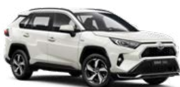
070 Pearl White lakier perłowy 4 400 PLN