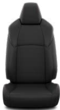
Tapicerka materiałowa w kolorze czarnym Standard w wersji Dynamic