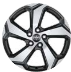
18" felgi aluminiowe z oponami 225/60 R18 Standard w wersji Dynamic