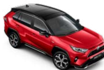
2SC Imperial Red/Attitude Black lakier specjalny bez dopłaty – Selection

Kolor nadwozia może być zależny od wersji wyposażenia.