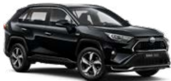
218 Attitude Black lakier metalizowany 2 900 PLN