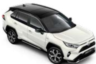
2QJ Pearl White/Attitude Black lakier perłowy bez dopłaty – Selection