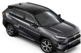
2QZ Royal Grey/Attitude Black lakier metalizowany bez dopłaty – Selection, Style i GR SPORT