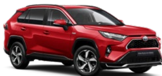
3U5 Imperial Red lakier specjalny 4 400 PLN