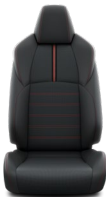
Tapicerka skórzana (skóra naturalna) Standard w wersji Style