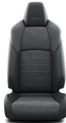
Tapicerka GR SPORT (zamsz syntetyczny i skóra syntetyczna) Standard w wersji GR SPORT