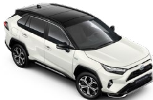
2PS Platinum White Pearl/Attitude Black lakier perłowy bez dopłaty – Selection, Style i GR SPORT

Kolor nadwozia może być zależny od wersji wyposażenia.