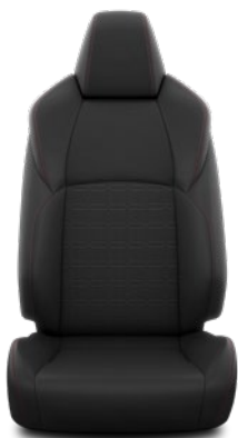
Tapicerka materiałowa w kolorze czarnym Standard w wersji Dynamic