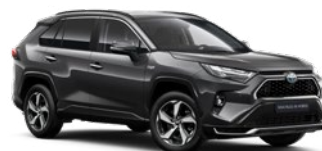
1G3 Royal Grey lakier metalizowany 2 900 PLN