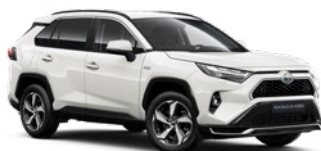
040 Pure White lakier podstawowy bez dopłaty