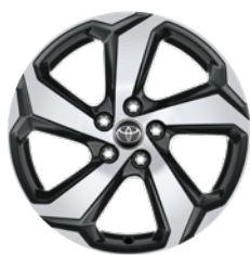
18" felgi aluminiowe z oponami 225/60 R18 Standard w wersji Dynamic