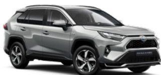
1D6 Misty Silver lakier metalizowany 2 900 PLN