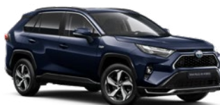
8X8 Elite Blue lakier metalizowany 2 900 PLN