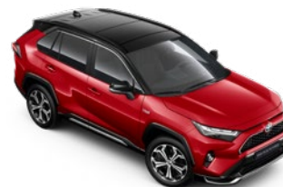
2SC Imperial Red/Attitude Black lakier specjalny bez dopłaty – GR SPORT