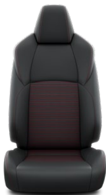
Tapicerka skórzana (skóra syntetyczna) Standard w wersji Selection