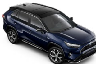
2RA Elite Blue/Attitude Black lakier metalizowany bez dopłaty – Selection, Style i GR SPORT