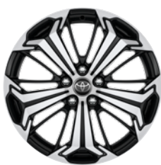
19" felgi aluminiowe z oponami 235/55 R19 Standard w wersjach Selection i Style