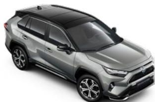
2QY Misty Silver/Attitude Black lakier metalizowany bez dopłaty – Selection, Style i GR SPORT