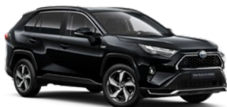
218 Attitude Black lakier metalizowany 2 900 PLN