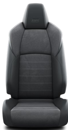
Tapicerka GR SPORT (zamsz syntetyczny i skóra syntetyczna) Standard w wersji GR SPORT