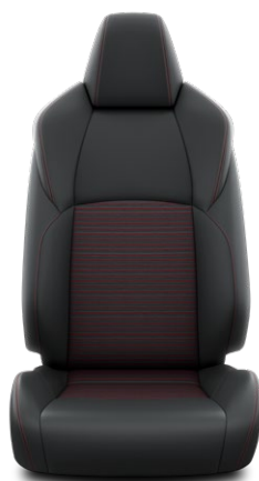
Tapicerka skórzana (skóra syntetyczna) Standard w wersji Selection