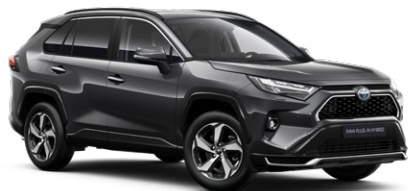
1G3 Royal Grey lakier metalizowany 2 900 PLN