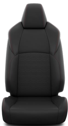
Tapicerka materiałowa w kolorze czarnym Standard w wersji Dynamic