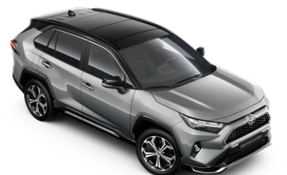
2QY Misty Silver/Attitude Black lakier metalizowany bez dopłaty – Selection, Style i GR SPORT