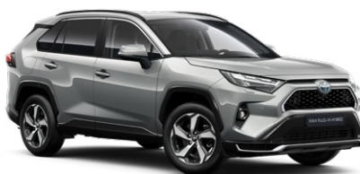
1D6 Misty Silver lakier metalizowany 2 900 PLN