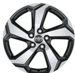
18" felgi aluminiowe z oponami 225/60 R18 Standard w wersji Dynamic