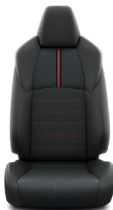
Tapicerka skórzana (skóra naturalna) Standard w wersji Style