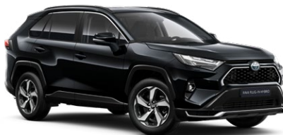
218 Attitude Black lakier metalizowany 2 900 PLN