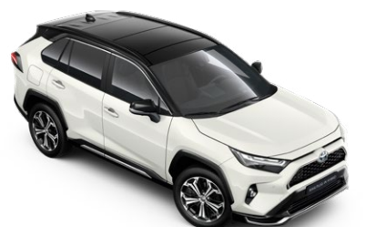
2PS Platinum White Pearl/Attitude Black lakier perłowy bez dopłaty – Selection, Style i GR SPORT

Kolor nadwozia może być zależny od wersji wyposażenia.