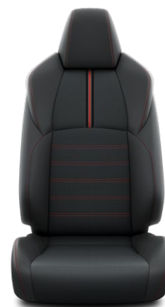
Tapicerka skórzana (skóra naturalna) Standard w wersji Style