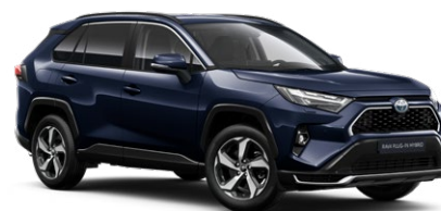
8X8 Elite Blue lakier metalizowany 2 900 PLN