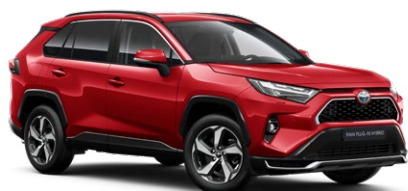
3U5 Imperial Red lakier specjalny 4 400 PLN