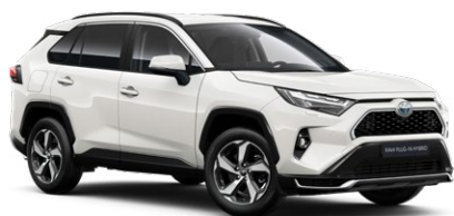
040 Pure White lakier podstawowy bez dopłaty