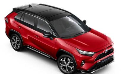
2SC Imperial Red/Attitude Black lakier specjalny bez dopłaty – GR SPORT