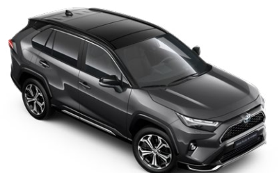
2QZ Royal Grey/Attitude Black lakier metalizowany bez dopłaty – Selection, Style i GR SPORT