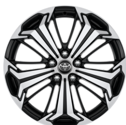
19" felgi aluminiowe z oponami 235/55 R19 Standard w wersjach Selection i Style