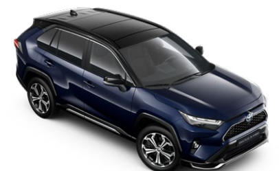
2RA Elite Blue/Attitude Black lakier metalizowany bez dopłaty – Selection, Style i GR SPORT