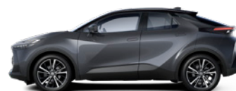
2NB Royal Grey/ Night Sky Black lakier metalizowany bez dopłaty – Style*, Executive, GR SPORT