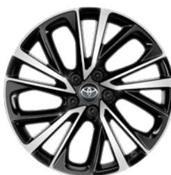
19" felgi aluminiowe z oponami 225/50 R19 Standard w wersji Executive