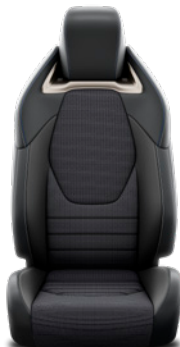
Tapicerka materiałowa z boczками ze skóry syntetycznej oraz elementami syntetycznego zamszu Standard w wersji Executive