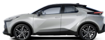
2VU Shimmering Silver/ Night Sky Black lakier metalizowany bez dopłaty – Style*, Executive, GR SPORT