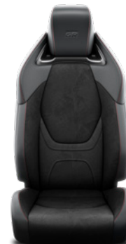
Tapicerka z ekologicznego zamszu Ultrasuede™ Standard w wersji GR SPORT