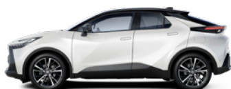
2VP Platinum White Pearl/ Night Sky Black lakier perłowy bez dopłaty – Style*, Executive, GR SPORT