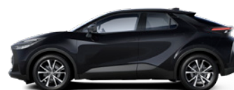
209 Eclipse Black lakier metalizowany 2 500 PLN – Comfort, Style