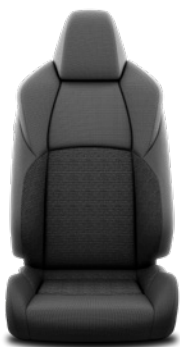
Tapicerka materiałowa w kolorze czarnym Standard w wersji Comfort