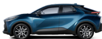
785 Dark Teal lakier metalizowany 2 500 PLN – Comfort, Style