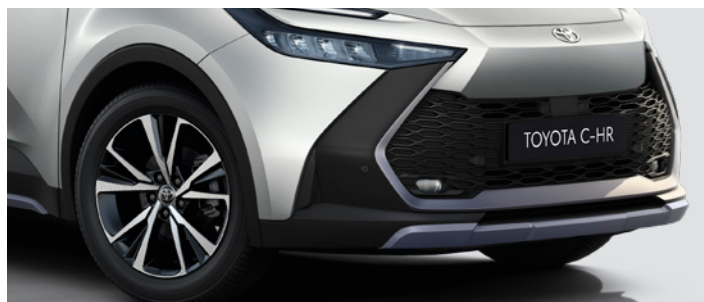
– Ozdobne osłony pod zderzak przedni i tylny – Ozdobne listwy dolne

dostępny dla wersji Comfort, Style i Executive