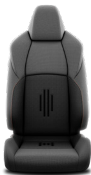
Tapicerka materiałowa w kolorze czarnym Standard w wersji Style