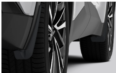
– Osłony przeciwblotne (przednie i tylne)