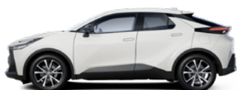
040 Pure White lakier podstawowy bez dopłaty – Comfort, Style