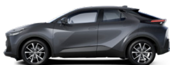
1G3 Royal Grey lakier metalizowany 2 500 PLN – Comfort, Style