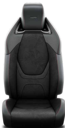
Tapicerka z ekologicznego zamszu Ultrasuede™ Standard w wersji GR SPORT