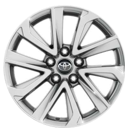
17" felgi aluminiowe z oponami 215/60 R17 Standard w wersjach Comfort i Comfort Plus