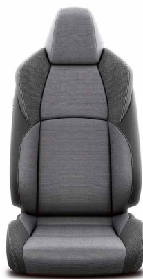
Tapicerka materiałowa w kolorze ciemnoszarym Standard w wersjach Comfort Plus i Style