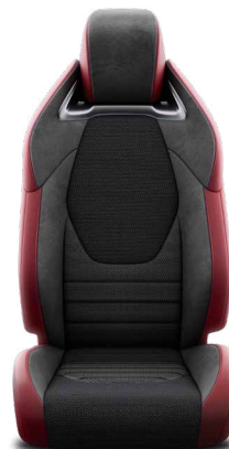
Tapicerka materiałowa w kolorze czarnym z elementami tkaniny Dinamica® i boczka- mi ze skóry syntetycznej w kolorze bordowym Standard w wersji Tokyo Edition