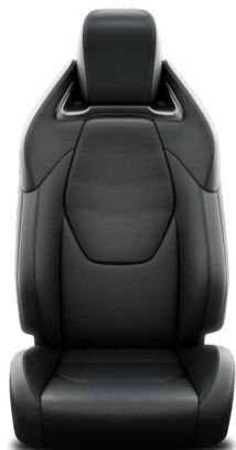
Tapicerka skórzana (skóra naturalna i syntetyczna) Standard w wersji Executive