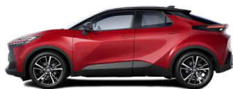
2TB Imperial Red/ Night Sky Black lakier specjalny bez dopłaty – Style*, Executive, GR SPORT