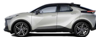
2MR Precious Silver/ Night Sky Black lakier metalizowany bez dopłaty – Style*, Executive, GR SPORT