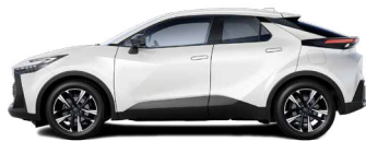
089 Platinum White Pearl lakier perłowy 3 500 PLN – Comfort, Comfort Plus, Style