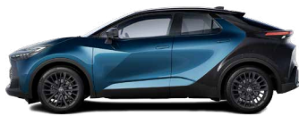
2YB Dark Teal/ Night Sky Black lakier metalizowany bez dopłaty – GR SPORT z Pakietem Dynamic, Tokyo Edition