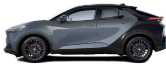
M29 Storm Grey/ Night Sky Black lakier metalizowany bez dopłaty – GR SPORT z Pakietem Dynamic, Tokyo Edition

Kolor nadwozia może być zależny od wersji wyposażenia.