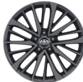
19" felgi aluminiowe w kolorze czarnym z oponami 225/50 R19 Standard w wersji Tokyo Edition