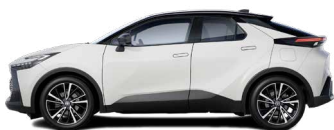
2MQ Pure White/ Night Sky Black lakier podstawowy bez dopłaty – Style*, Executive, GR SPORT