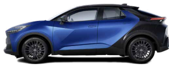
M78 Dark Blue/ Night Sky Black lakier metalizowany bez dopłaty – GR SPORT z Pakietem Dynamic, Tokyo Edition