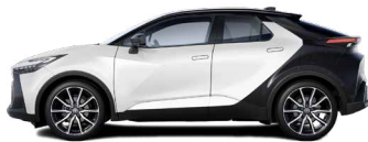
2VP Platinum White Pearl/ Night Sky Black lakier perłowy bez dopłaty – GR SPORT z Pakietem Dynamic, Tokyo Edition