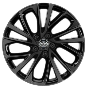
19" felgi aluminiowe GR SPORT z oponami 225/50 R19 Standard w wersji GR SPORT (z wyjątkiem wersji z napędem 2.0 Hybrid Dynamic Force 180 KM)