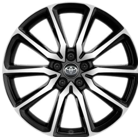
20" felgi aluminiowe GR SPORT z oponami 245/40 R20 Standard w wersjach GR SPORT (tylko 2.0 Hybrid Dynamic Force 180 KM) oraz GR SPORT z Pakietem Dynamic (tylko 2.0 Hybrid Dynamic Force Plug-in 223 KM e-CVT)