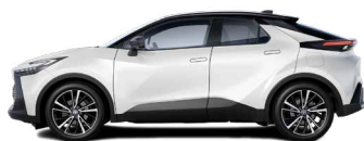
2VP Platinum White Pearl/ Night Sky Black lakier perłowy bez dopłaty – Style*, Executive, GR SPORT