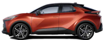
M35 Volcano Orange/ Night Sky Black lakier metalizowany bez dopłaty – Style*, Executive, GR SPORT