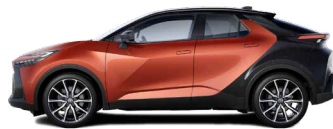
M35 Volcano Orange/ Night Sky Black lakier metalizowany bez dopłaty – GR SPORT z Pakietem Dynamic, Tokyo Edition