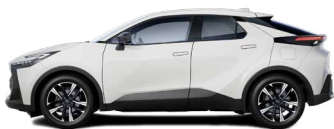
040 Pure White lakier podstawowy bez dopłaty – Comfort, Comfort Plus, Style