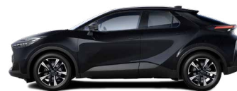
209 Eclipse Black lakier metalizowany 2 500 PLN – Comfort, Comfort Plus, Style