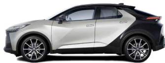
2MR Precious Silver/ Night Sky Black lakier metalizowany bez dopłaty – GR SPORT z Pakietem Dynamic, Tokyo Edition