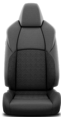
Tapicerka materiałowa w kolorze czarnym Standard w wersji Comfort