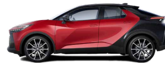
2TB Imperial Red/ Night Sky Black lakier specjalny bez dopłaty – GR SPORT z Pakietem Dynamic, Tokyo Edition