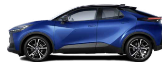
M78 Dark Blue/ Night Sky Black lakier metalizowany bez dopłaty – Style*, Executive, GR SPORT