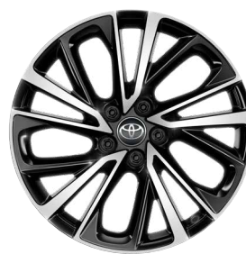
19" felgi aluminiowe z oponami 225/50 R19 Standard w wersji Executive