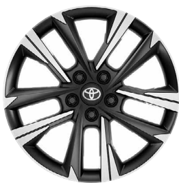
18" felgi aluminiowe z oponami 225/55 R18 Standard w wersji Style