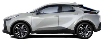
1L0 Shimmering Silver lakier metalizowany 2 500 PLN – Comfort, Comfort Plus, Style