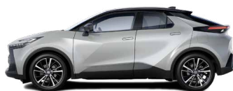
2VU Shimmering Silver/ Night Sky Black lakier metalizowany bez dopłaty – Style*, Executive, GR SPORT