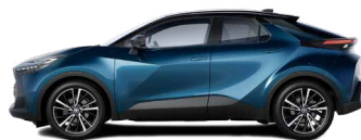
2YB Dark Teal/ Night Sky Black lakier metalizowany bez dopłaty – Style*, Executive, GR SPORT